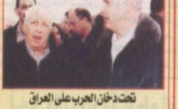
تحت دخان الحرب على العراق، خارطة الطريق تبحت من الطريق!