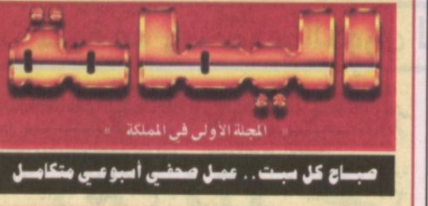
المجلة الأولى في المسلكة، صباح كل بست.. عمل صحفي أسبوعي متكامل