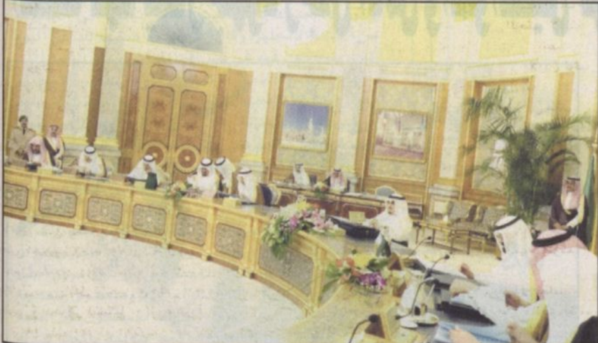
خادم الحرمين الشريفين مترسلاً المجلس أمس

تلك الفئة الضالة التي تتبنى مثل تلك الأفكار الهدامة والشاذة وما تزخره من انحلال في عقول قلة من الشباب غير المدرك لفساحة الخطأ والجرم المرتكب هدفها بعيد عن الدين وهو الإفساد في الأرض وقتل النفس البريئة بغير حق. وأشار وزير الثقافة والإعلام إلى أن المجلس اطلع اثر ذلك على تقرير اعلامي حول آخر الاحداث على صعيد المنطقة والعالم وموقف المملكة تلك وجدد المجلس موقف المملكة الثابت من مكافحة الارهاب وتعاونها الدائم مع المجتمع الدولي للقضاء على هذا الوهاب. وسين معالي الدكتور فؤاد الفارسي أن المجلس أشار إلى أن الجدار الأمني الذي تبنيه اسرائيل في الضفة الغربية لا يساعد على انقاذ خارطة الطريق. ومن جهة أخرى وفيما يتعلق بالشأن العراقي فإن المجلس يرحب بحوار عربي لمناقشة أوضاعه. واختتم معاليه بيانه مفيداً أن المجلس اثر استعراضه جدول الأعمال أصدر القرارات التالية: أولاً: بعد الاطلاع على طلب صاحب السمو الملكي وزير الداخلية تطبيق قرار مجلس الوزراء رقم ٢٣٦٠، وتاريخ ١٤٢٨٩/٢١هـ على ضباط قوات الطوارئ الخاصة النفس البريئة بغير حق. وذلك بمنحه علاوة الأمن الشهرية المنصوص عليها في ذلك القرار وقدرها ٢٥ في المائة من الراتب الاساسي مساوية لهم مع أفراد تلك القوات قرر مجلس الوزراء الموافقة على ذلك. ثانياً: بعد الاطلاع على ما رفته صاحب السمو الملكي وزير الخارجية بشأن المشروع الوطني المقترح لتأجيرات التشريعية والادارية الخاصة بتصفيد، اتفاقية حظر استحداث وتاجز وتخزين واستعمال الاسلحة الكيميائية وتدمير تلك الاسلحة، المصادق عليها بالمرسوم الملكي رقم ٤٠٠/م وتاريخ ١٤١١٤/٣/١هـ وبعد النظر في قرار مجلس الشورى رقم ١٨ / ١٣ - وتاريخ ١٤١٢٤/٤/١٥هـ قرر مجلس الوزراء الموافقة على