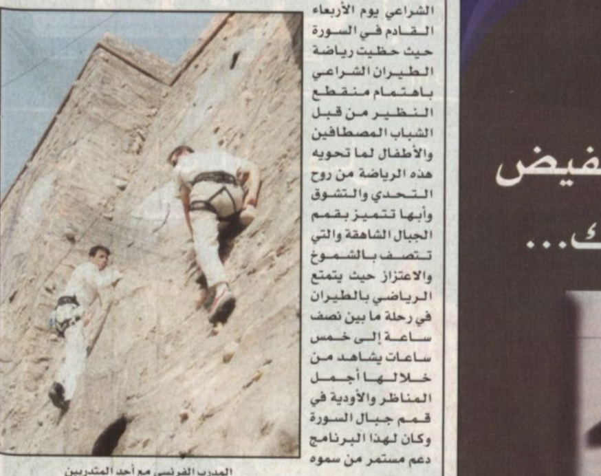
المدرّب الفرنسي مع أحد المتدربين

استعداد للطيران الكريمة ومن صاحب السمو الملكي الأمير خالد الفيصل أمير منطقة عسير رئيس لجنة التشجيع السياحي منذ انطلاقته قبل أربع سنوات وتحت إشراف مدربين عالميين في هذا المجال حيث أسهموا بنشر هذه الرياضة بالمنطقة وتشجيع المصطافين على مزاولتها بكل يسر