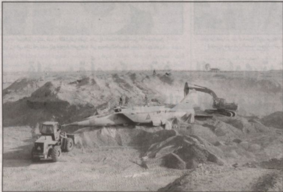
فرق التنقيش العسكري الأمريكي يستعمل البندوزات لاستخراج طائفة من طراز ميغ - 25 لربعد ان نظها النظام العراقي السابق تحت الرمال في السادس من يوليو 2003م.

تربية ومسارات التحرك موجودة.. هناك حولها من ملك فعلاً ازدهاراً سياحياً هو الأقل منها في تنوع خيارات السياحة ومجالاتها بل إن هناك عواصم خانقة الحرارة أصبحت فنادقها تضيق بازدياد الرواد في حين لم تزال الفنادق في دمشق تقتدر امكانيات المناهضة القادرة.. في سوريا صناعات كانت أن تندثر وبالدات في مجالات النسيج وهندسة الأخشاب والحديد ومهارات العمارة الشرقية.. أين هي الآن.. قبل الحرب الأهلية اللبنانية وبعد الوحدة مع مصر ازدهرت في لبنان هذه المجالات التي هاجرت من دمشق.. أين هي الآن.. تخرج من العاصمة إلى بداية الحدود مع لبنان فتقطع مئات الكيلومترات في مساحات مناخية وزراعية متميزة تتخللها مساحات إعمار وحدائق تباع بأقل من نصف ثمنها رغم مضاعفة المساحة في أي دولة مجاورة.. إنني لا أفي دور الرصاص في مواجهة شراسة الأطماع الإسرائيلية لكن المرحلة أصبحت تحتم أيضاً وجود اليورو والدولار والين في هذه المواجهة.. إن سوريا تملك كل امكانيات المناهضات الاقتصادية وبالتالي تصعيد كفاءة قدراتها الخاصة لكن يجب أن تتوفر سوية بنكية وحرية تبادل اقتصادي وانفتاح غير مشروط على كل أدوات العصر الحضارية.. وهي لا تموزها القدرات البشرية المتمكنة ولكنها تستعجل - وهذا مشروع - فتح أبواب الانطلاق..