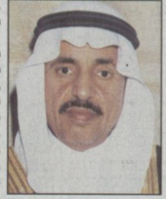
د. محمد الرشيد

حوار - محمد الغنيم: أكد معالي وزير المعارف الدكتور محمد بن أحمد الرشيد أن توجيه سمو ولي العهد محمد بن عبد العزيز ولي العهد نائب رئيس مجلس الوزراء ورئيس الحرس الوطني بالتحظر في الحلول المعالجة لأوضاع المدارس والجامعات المهتدة والأبلة لسقوط ودراسة هذا الموضوع بشكل عاجل وحاسم يدل على حرصه - حفظه الله - وغير مستغرب.