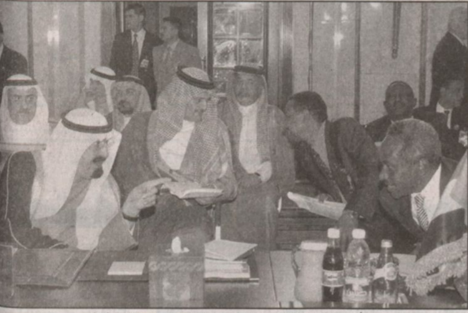
الأمير عبدالله يتحدث إلى رئيس الوفد السوداني خلال الجلسة الختامية (ب)