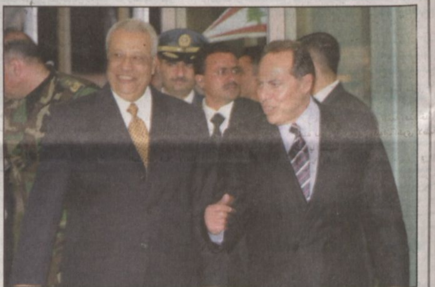
رئيس الوزراء المصري عاطف عبيد مع الرئيس اللبناني اميل لحود في مطار بيروت الدولي