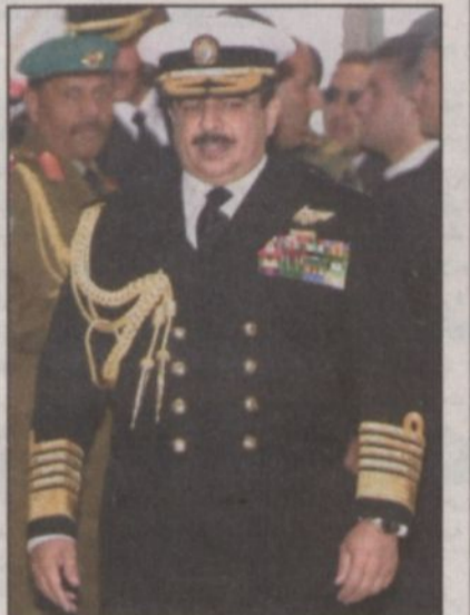
ملك البحرين حمد بن عيسى آل خليفة أثناء وصوله لمطار بيروت الدولي لحضور القمة العربية

عمان، كونا: أعلن هنا أمس ان كلا من ملك المغرب محمد السادس وملك البحرين الشيخ حمد بن عيسى آل خليفة سيوفان اليوم بزيارة للأردن وصفت بأنها خاصة. وقالت مصادر رسمية أردنية لوكالة الأنباء الكويتية (كونا) ان الملك محمد السادس والملك حمد بن عيسى آل خليفة سيصلان إلى عمان قادمين من بيروت بعد انتهاء أعمال القمة العربية. وأضاف ان استقبالاً رسمياً وشعبياً سيجري لضييفي الأردن وسيتم الاحتفاء بهما بتسليمهما مفتاح عمان الذهبي. وسيحضر ملك البحرين احتفالاً شعبياً في منزله (غمدان) يتم خلاله إطلاق اسمه على هذا المنتره تقديراً من الشعب الأردني.