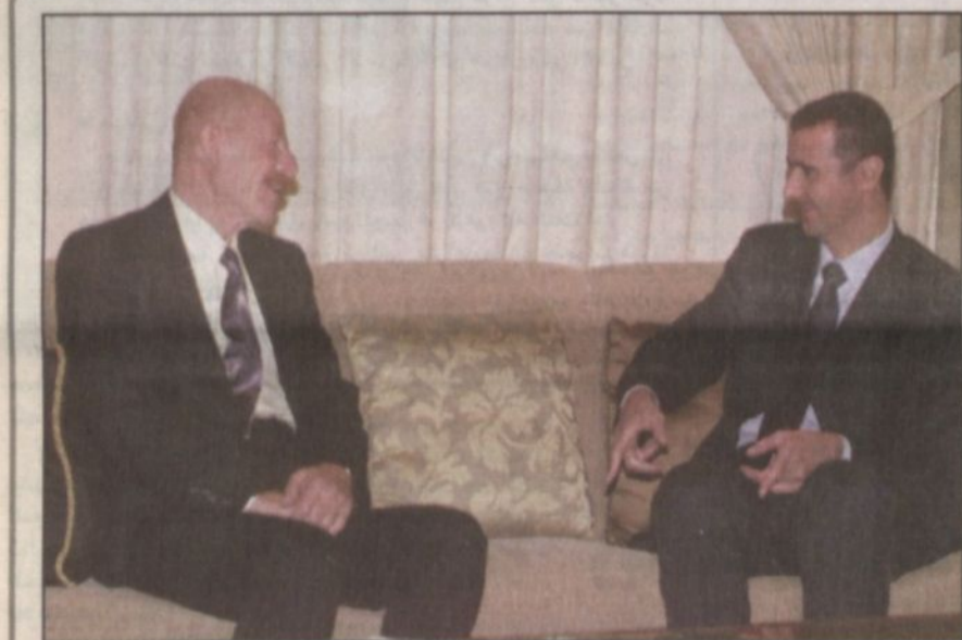
نائب الرئيس العراقي عزت ابراهيم يتحدث مع الرئيس السوري بشار الأسد في مقر سكنه بالفندق في بيروت

بيروت، مكتب «الرياض»، جان فغالي: زيارة الأمير عبدالله للبنان هي الثالثة في غضون خمس سنوات. الزيارة الأولى كانت في السادس والعشرين من أيار/ مايو عام ١٩٩٧م، والزيارة الثانية كانت في الثالث من آذار (مارس) عام ٢٠٠٠م. أما زيارته اليوم فهي الأبرز حيث يتوقع أن يكون نجم القمة العربية التي ستكون قمة المبادرة السعودية.