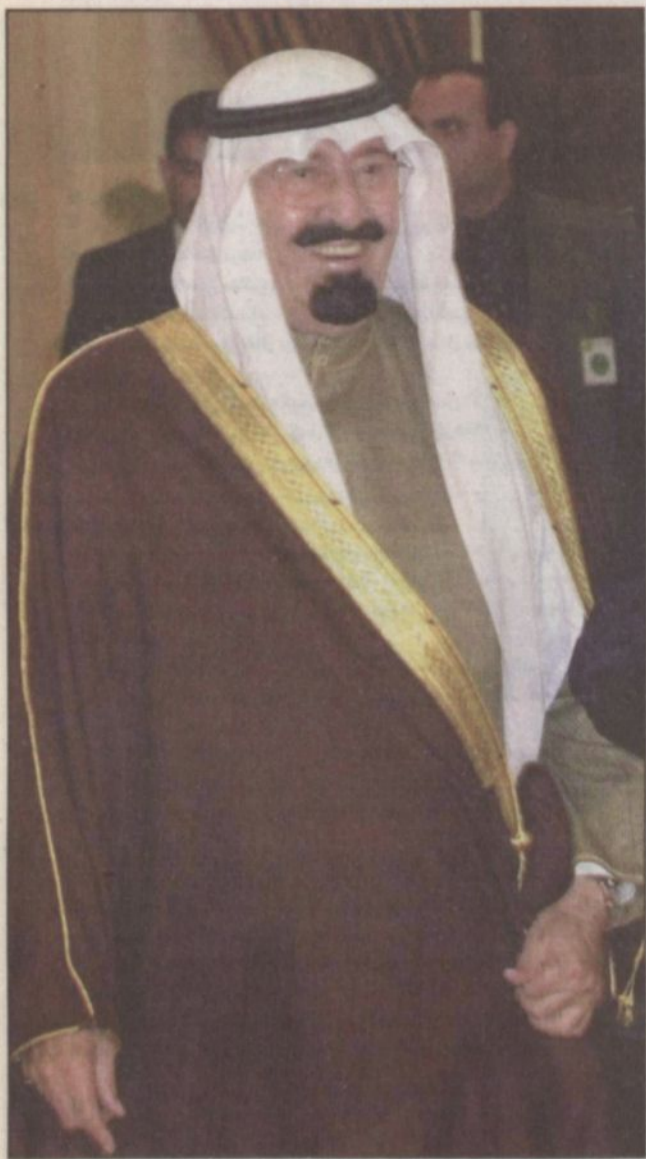
سمو ولي العهد الأمير عبدالله بن عبدالعزيز لدى وصوله لمطار بيروت الدولي لحضور القمة العربية