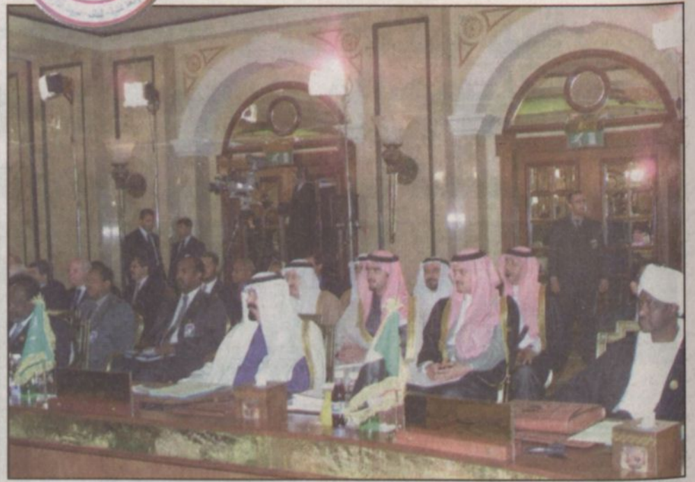
سمو ولي العهد يتراس وفد المملكة إلى القمة

بيروت. و.أ.س: قام صاحب السمو الملكي الأمير عبد الله بن عبدالعزيز ولي العهد نائب رئيس مجلس الوزراء رئيس الحرس الوطني ورئيس وفد المملكة إلى مؤتمر القمة العربية الرابعة عشرة بزيارة أمس فخامة رئيس الجمهورية العربية السورية الدكتور بشار الأسد في مقر إقامة فخامته في بيروت. وجرى خلال الزيارة بحث عدد من الموضوعات في