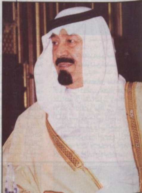
الملك عبد الله الثاني ملك الأردن