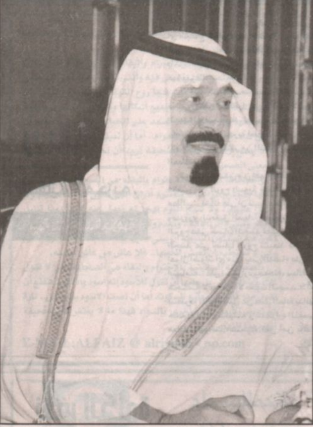
الأمير عبد الله