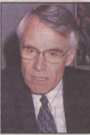
السفير الكندي مالفين ماك دونالد.

لكننا مشيراً إلى انه من الموضوعات الأخرى التي ترغب كثيراً في مناقشتها أيضاً مع سمو ولي العهد مكافحة الإرهاب والتبادل الثقافي. وقال السفير ماك دونالد إن علاقتنا بالمملكة ممتازة حيث تعمل نحو ٢٠٠ شركة كندية في المملكة كما يعمل نحو سبعة آلاف كندي في مختلف المجالات الفنية العالية بالمملكة. وفي اجابة عن سؤال حول زيارات أخرى للمنطقة من المسؤولين الكنديين قال السفير ماك دونالد إن وزير الدولة لشؤون شرق أوروبا والشرق الأوسط السيد نوستين سيقيم بجولة خليجية في نهاية شهر مارس (آذار) المقبل تشمل المملكة.