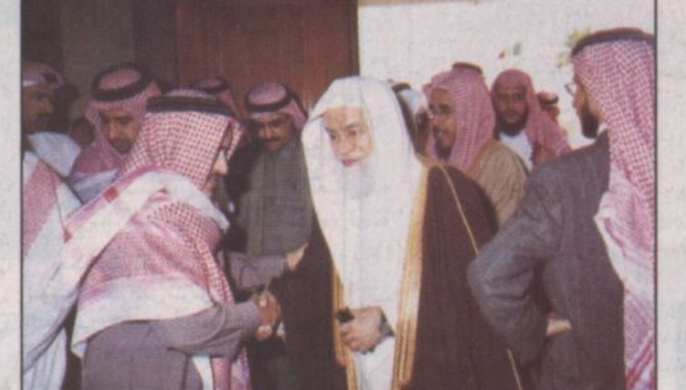
الأمير عبدالرحمن بن عبدالله في مقدمة المعزين