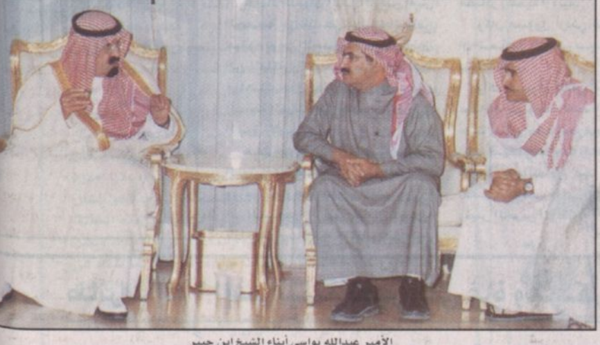
الأمير عبدالله بن ياسين مع أبناء الشيخ ابن جبير

كتب: محمد الشيباني: ■ قام صاحب السمو الملكي الأمير عبدالله بن عبدالعزيز - حفظه الله - نائب رئيس مجلس الوزراء ورئيس الحرس الوطني مساء أمس بزيارة إلى منزل الفقيد معالي الشيخ محمد بن إبراهيم بن جبير - رحمه الله - وقدم التعزية لأبنائه. وكان في معية سموه صاحب السمو الملكي الأمير نواف بن عبدالعزيز رئيس الاستخبارات العامة، وصاحب السمو الملكي الأمير خالد بن عبدالعزيز أمير منطقة الجوف، وصاحب السمو الأمير فيصل بن عبدالله وكيل الحرس الوطني