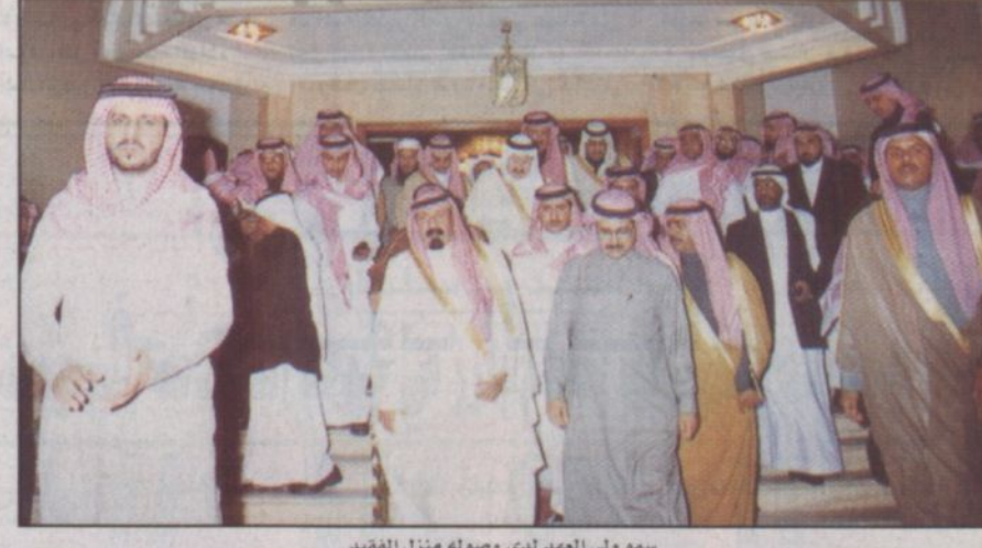
سمو ولي العهد لدى وصوله منزل الفقيد

الرياض، ١٠ أ.س. ■ تلقى صاحب السمو الملكي الأمير عبدالله بن عبدالعزيز - حفظه الله - عدداً من برقيات التعازي بوفاة معالي رئيس مجلس الشورى الشيخ محمد بن إبراهيم بن جبير - رحمه الله - من كل صاحب السمو الشيخ خليفة بن سلمان آل خليفة، رئيس وزراء دولة البحرين، صاحب السمو الشيخ سلطان بن محمد بن سلطان القاسمي، نائب حاكم الشارقة، صاحب السمو الشيخ أحمد بن سلطان القاسمي، نائب حاكم الشارقة، معالي الأستاذ نور الدين بو شوك، الأمين العام للاتحاد البرلماني العربي. وقد أجابهم سمو الكريم - حفظه الله - بالتقدير على تعزيتهم ودعواتهم الطيبة ودعا الله العلي العظيم أن يتغمدهم الله بواسع رحمته ويبدخه فضيح جناته انه سميع مجيب.