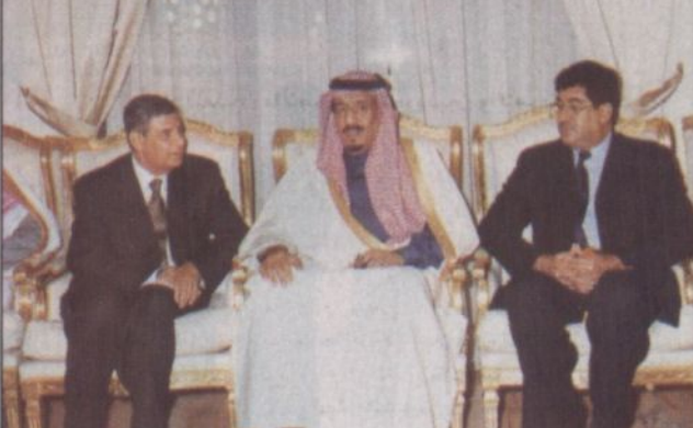
الأميران لدى زيارته لأسرة ابن جبير برحمة الله