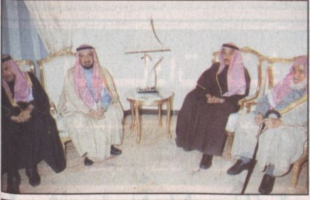
عدد من الوزراء خلال العزاء

كتب: محمد الشيباني: ■ قام عدد من أصحاب السمو الأمراء وأصحاب المعالي الوزراء أمس بزيارة إلى منزل الفقيد الشيخ محمد بن إبراهيم بن جبير - رحمه الله - حيث قدموا التعازي لأبنائه حيث قام بالزيارة صاحب السمو الملكي الأمير خالد بن سلطان بن عبدالعزيز مساعد وزير الدفاع والطيران للشؤون العسكرية وصاحب السمو الأمير فيصل بن مشعل بن سعود المشرف على مركز الدراسات والبحوث بمكتب سمو النائب الثاني. كما قام معالي وزير التعليم العالي الدكتور خالد العنقري، ومعالي وزير المعارف الدكتور محمد الرشيد، ومعالي وزير الخدمة المدنية الأستاذ محمد الفايز ومعالي وزير التخطيط الدكتور خالد القصيبي والأستاذ ناصر الداود مدير عام المكتب الخاص لسمو أمير منطقة الرياض وعدد من الأدباء والمثقفين بضيوف مهرجان الجنادرية بتقديمهم الشيخ يوسف الترضاي بزيارة إلى منزل الفقيد حيث قدموا التعازي لأبنائه داعين الله أن يفرغ للفقيد ويسكنه فسيح جناته.