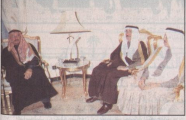
الأميران خالد بن سلطان و فيصل بن مشعل ابن سعود والوزراء وضيوف الجنادرية يعزون أبناء ابن جبير في وفاة والدهم