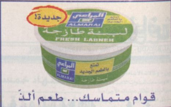
الطبعة ٢٢ الصادرة ٢٠٠٢ - ٢٠٠٣ - العدد ١١٣٢٢ - السنة التاسعة والثلاثون