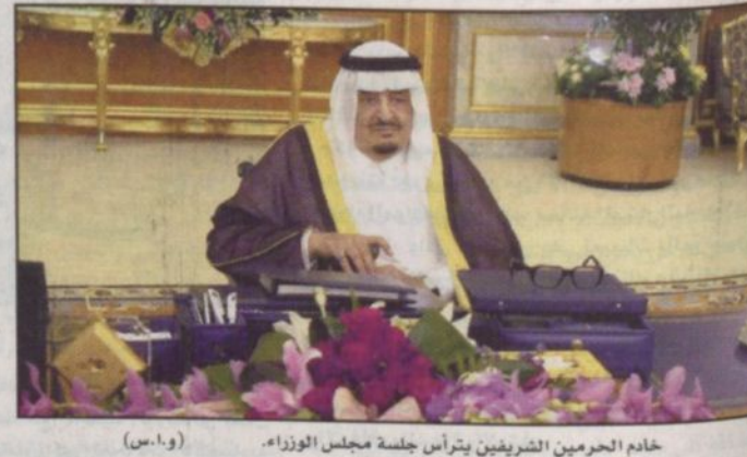
خادم الحرمين الشريفين يترأس جلسة مجلس الوزراء

الملك فهد يوجه بإرسال مساعدات عاجلة وتنظيم حملة تلفزيونية شاملة لجمع التبرعات للشعب الفلسطيني... خادم الحرمين يتبرع بـ ١٠ ملايين ريال في بداية حملة لمساندة الانتفاضة ويناشد الولايات المتحدة القيام بدورها المؤثر للضغط على (إسرائيل)