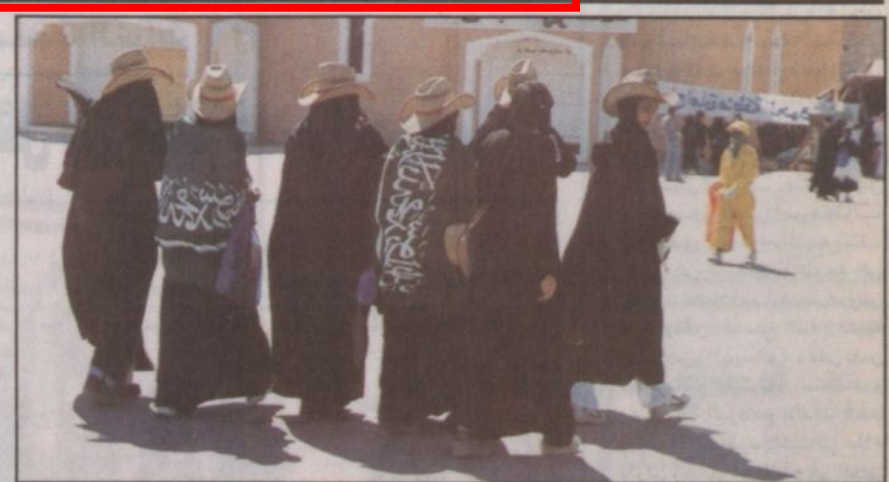
حضور عائلي مميز صباح أمس