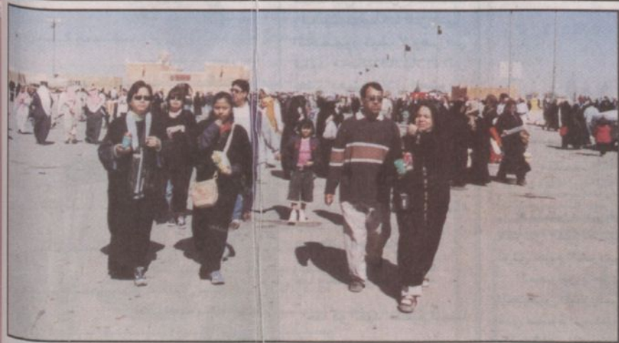
وفود أجنبية زارت القرية أمس