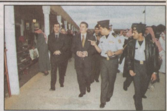
الوزير اللبناني يتجول في القرية الشعبية بالجنادرية

ضمن العديد من الحرف والبيع والمنتجات الوطنية التي تجسد تراث المملكة. واستمع معاليه الى شرح موجز من المسؤولين القائمين على القرية الشعبية عن قرية الجنادرية وتطورها من عام ١٩٨٠ وفي نهاية الجولة أكد معالي وزير السياحة اللبناني أن مهرجان الجنادرية خطوة مميزة من المملكة لتشجيع السياحة موضعاً أن المهرجان يجمع تراث المملكة