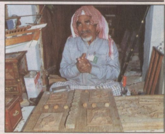
الفنان بين المشغولات التراثية

يجد الزائر للقرية الشعبية بالجنادرية حرفة النقش على الخشب كأحد الأعمال التراثية الفنية القديمة ويعمل في هذه الحرفة عدد من كبار السن من مختلف مناطق المملكة من هوة هذه الحرفة، ويستطيع الزائر للقرية ان يرى طريقة عمل هذه الحرفة على الأخشاب ومهارة عمل ذلك على شكل لوحات جمالية معبرة. أحد هواة هذه الحرفة من المنطقة الشرقية زناه في دكانه بالقرية وشاهدنا لوحات خشبية غاية في الجمال ومختلفة الأشكال عملها بيده شخصياً وقال انه يتطلب من الوقت لعمل لوحة واحدة مما شاهدنا مدة شهر، إلى شهر ونصف، إلا انه رفض بيع هذه اللوحات مؤكداً انها للعرض فقط.