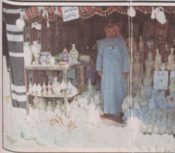
صناعة الفخار إحدى مشاركات دولة البحرين الشقيقة في القرية

الرياض، التي زارته في القرية الشعبية انه يستطيع ان يعمل (٢٠) قطعة من هذا النوع في اليوم الواحد باختلاف أشكالها حيث منها ما هو للزينة ومنها ما يستخدم لأغراض مختلفة وعن أسعارها يقول انها تتراوح ما بين (٤٠) ريالاً إلى (٢٠٠) ريالاً، وذلك بحسب حجم القطعة، كما ان منها ما يصل لأعلى من هذا السعر لكن الاقبال عليه محدود.