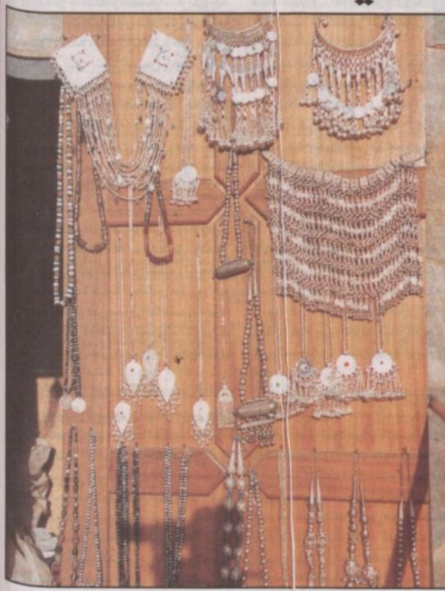
عرض لبعض الحلي النسائية

استحدث جناح منطقة الباحة بالجنادرية لهذا العام متحف تراثياً داخل بيت الباحة تبرز فيه الموروثات الشعبية القديمة التي تمتاز بها المنطقة حيث يشتمل المتحف على عدد من المصنوعات الجلدية والألعاب القديمة وغيرها من الحرف. كما يمكن لزائر الجناح مشاهدة كيفية استخراج السنن اليدوي والاقط وبقية المعروضات الأخرى كصناعة السيوف