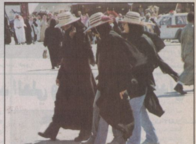
الساحات داخل القرية صباح أمس الخميس