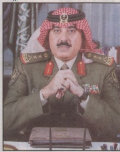
الأمير الفريق أول متعب بن عبدالله

يرعى صاحب السمو الملكي الفريق أول ركن متعب بن عبدالله بن عبدالعزيز نائب رئيس الحرس الوطني المساعد للشؤون العسكرية نائب رئيس اللجنة العليا للمهرجان اختتام مسابقة القرآن الكريم التاسعة بالحرس الوطني اليوم الجمعة بمشيئة الله تعالى وذلك بعد صلاة المغرب في قاعة الملك فيصل للمؤتمرات ضمن نشاطات المهرجان الوطني السابع عشر للتراث والثقافة. أوضح ذلك وكيل الحرس الوطني للشؤون الثقافية والتعليمية المساعد المشرف العام على المسابقة الدكتور سليمان بن عبد الرحمن الزهير. وقد عبر عن شكره واعتزازه برعاية سمو الأمير متعب بن عبدالله بن عبدالعزيز للحفل الذي يكرم فيه أبناءه المتفانيين في حفظ كتاب الله من مدارس الحرس الوطني ووزارة المعارف ووزارة الشؤون الإسلامية والأوقاف والدعوة والإرشاد ووزارة الدفاع والطيران والمعاهد العلمية بجامعة الإمام محمد بن سعود الإسلامية مشيراً إلى أن عدد المشاركين بلغ ٢٨٣ متسابقاً يمثلون ٤٩ مدرسة بالإضافة إلى معهد القرآن الكريم المتوسط والثانوي بالحرس الوطني. وأشار الدكتور سليمان الزهير إلى أن المسابقة حققت نتائج مشرفة في حفظ كتاب الله واثقائه وذلك بفضل الله ثم بتوجيهات من صاحب السمو الملكي الأمير عبد الله بن عبدالعزيز ولي العهد نائب رئيس مجلس الوزراء رئيس الحرس الوطني ومتابعة من صاحب السمو الملكي الأمير بدر بن عبدالعزيز نائب رئيس الحرس الوطني وصاحب السمو الملكي الفريق أول ركن متعب بن عبدالله بن عبدالعزيز.