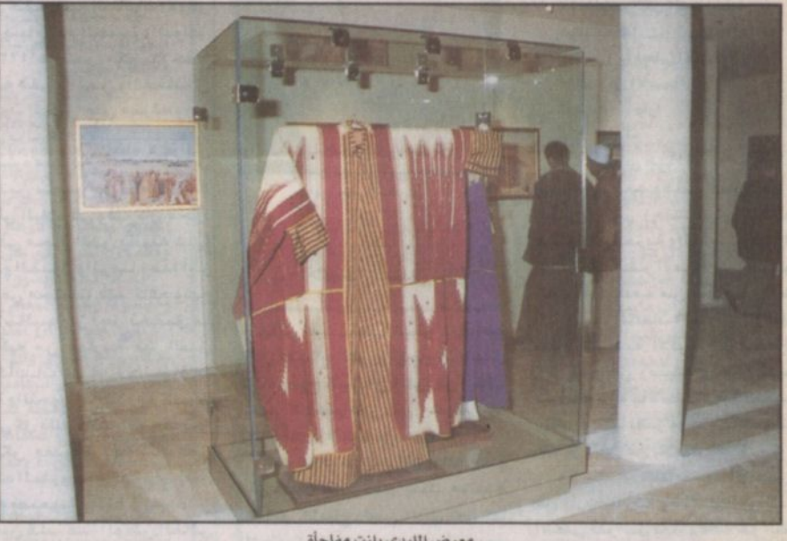
معرض الليدي بلنت مفاجأة

الأكلات الشعبية التي تشتهر بها مثل الحنيني والجمرية والرفغان والمعقوش والكبيرة والمعصيدة إضافة إلى بعض المشروبات مثل مديس البزل وعصير الترنج كما يحتوي البيت الحائلي أيضاً على معرضين الأول معرض رحلة في حائل والذي يحتوي على معلومات عن حائل قديماً وحديثاً، والثاني هو معرض الليدي ان بلنت الرحالة الانجليزية والذي يحتوي على عدد من الرسومات والصور التاريخية والملبوسات القديمة التي تعود إلى أكثر من ١٢٣ سنة والتي جسدتها الرحالة خلال رحلتها من بيروت إلى بغداد مروراً بمنطقة حائل.