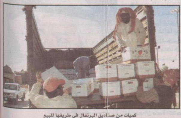
كميات من سناديق البرتقال في طريقها للبيع

حظي برتقال منطقة نجران بإقبال كبير من زوار المهرجان حيث تجلب كميات منه باستمرار من مزارع نجران وتنفذ جراء الطلب المتزايد عليها دوماً. ويتميز برتقال نجران بطعمه المميز ما جذب عدداً من زوار المهرجان إليه.