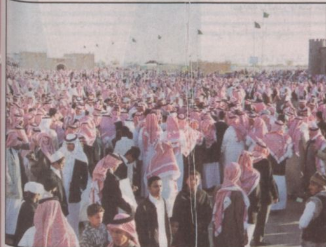
أعداد غفيرة شهدت القرية من الرجال مساء أمس الخميس

شهدت ساحة العروض بمهرجان الجنادرية عصر أمس حضوراً كثيفاً فاق كل التوقعات حيث بلغ عدد الزوار (أكثر من ١٥٠) ألف زائر وغطى الحضور الساحة الخاصة بإقامة العروض الفلكلورية والرقصات الشعبية والتي لقيت تجاوباً من الزوار الذين شاركوا بها، وكان زوار المهرجان قد حضروا في وقت مبكر عند أبواب الدخول التي