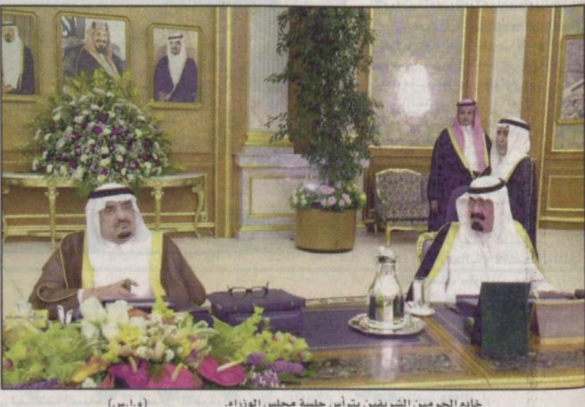
خادم الحرمين الشريفين يترأس جلسة مجلس الوزراء (و.ا.س)

جدة - واس: أكد صاحب السمو الملكي الأمير نايف بن عبدالعزيز وزير الداخلية أن المملكة قامت منذ عهد الملك عبد العزيز على شرع الله وسنة نبيه محمد صلى الله عليه وسلم وهي... مطلع خادم الحرمين الشريفين المجلس على فعوى المباحثات والمشاورات التي أجراها