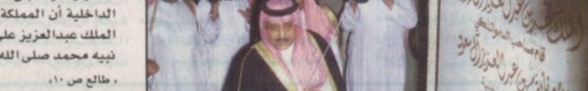
الأمير نايف يزرع الشتلة عن النخلة التذكارية

الأمير نايف يزرع الشتلة عن النخلة التذكارية