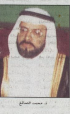
د. محمد الصائغ

كتب - عبدالمجيد المطوع: أشاد وكيل وزارة المعارف لكليات المعلمين الدكتور محمد حسن الصائغ بتوجيه صاحب السمو الملكي الأمير عبدالله بن عبدالعزيز ولي العهد نائب رئيس مجلس الوزراء رئيس الحرس الوطني المتمضن إيجاب حلول عاجلة لأوضاع المدارس والجامعات المهتدة والآلية للسلامة. وقال في تصريح له (الرياض): إن هذا القرار ليس بغريب على قيادتنا فهو يتطابق من حرصه على مصالح الأمة، ويأتي من ضمنها مصالح الطلاب والطالبات في مدارسها.