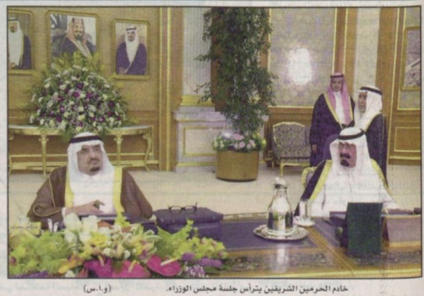
خادم الحرمين الشريفين يترأس جلسة مجلس الوزراء

جدة، و.أ.س: أكد صاحب السمو الملكي الأمير نايف بن عبدالعزيز وزير الداخلية أن المملكة قامت منذ عهد الملك عبدالعزيز على شرع الله وسنة نبيه محمد صلى الله عليه وسلم وهي