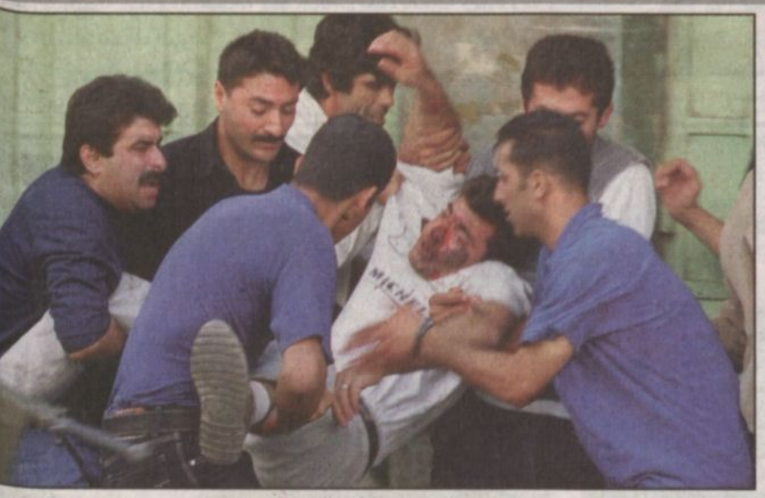
الشهداء يتساقطون بالمعشرات

هذا الموقف من الحكومة الأمريكية هو الذي دعا الأمير عبدالله لفتح صفحة تاريخية في القضية الفلسطينية