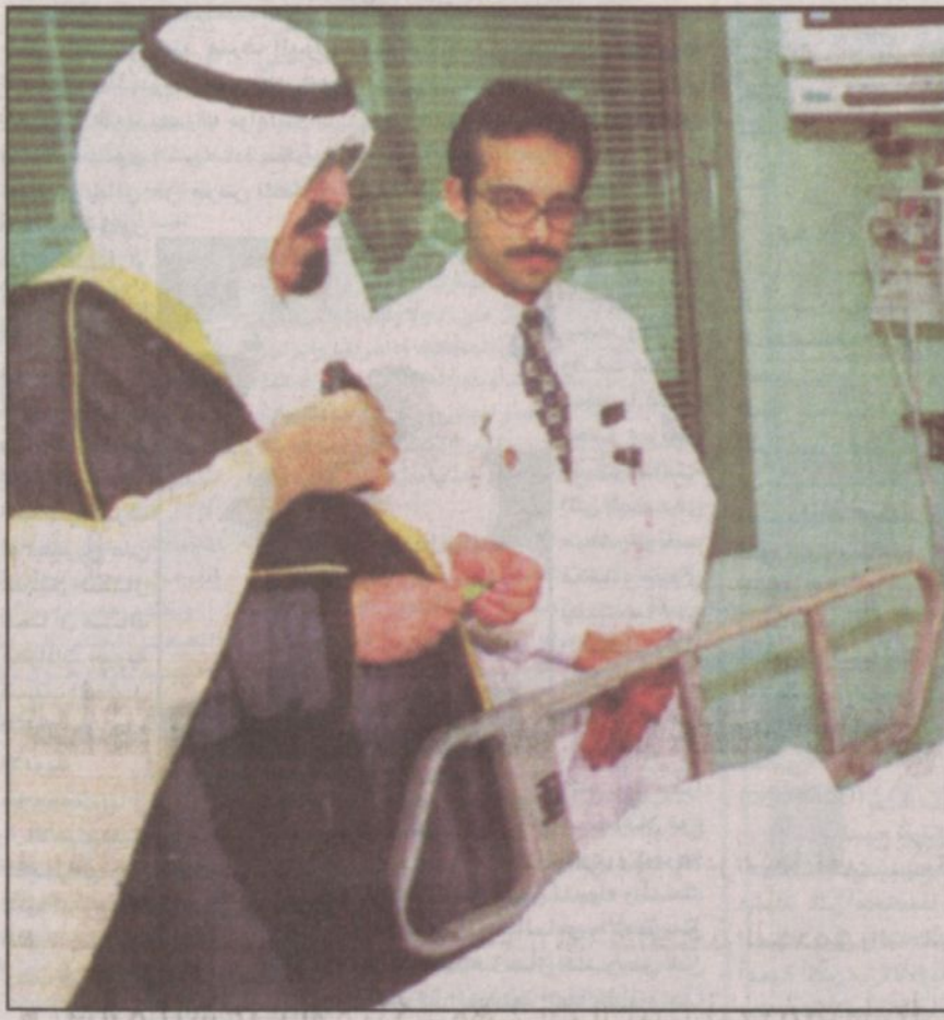
الأمير عبدالله يزور أحد الجرحى الفلسطينيين من الأطفال في المستشفى التخصصي

متفاناً بهذا ولكنه صدم عندما كان يسمع تصريحات بوش ووقوفه إلى جانب إسرائيل وانحيازه الكامل وروايته للتعف الإسرائيلي الذي كان يمارس ضد الشعب الفلسطيني، ثم أتت الخاتمة عندما صرح كان هناك حدث معين، عندما أتى وزير خارجية ألمانيا والتقى في بون أو في برلين، في نفس الليلة صرح كولين باول بموافقة على هذا اللقاء وبإيرك. إلا أن الرئيس جورج بوش الابن في اليوم الثاني خرج بتصريح كأنه ينطق بلسان شارون وقال بالحرف الواحد أن اللقاء يجب أن يكون على أساس الشروط الإسرائيلية، أي أنه تبنى موقف شارون بالكامل. وهذا ما دعا الأمير عبدالله إلى فتح صفحة مواجهة مع بوش وكانت الرسالة المعروفة والتاريخية والمكثورة من ثلاث عشرة صفحة ونحن نطلعنا عليها. ثم كان بعد ذلك رد الرئيس بوش برسالة أخرى للأمير عبدالله في ١٤٢٣، ٢٣٨، ٢٤٢، والأرض مقابل السلام، ووافقنا على الوثيقة التي أرسلها بوش إلى الأمير عبدالله بن عبدالعزيز. وجاءت بعد المعاناة الكبيرة التي شعر بها سمو الأمير عبدالله نتيجة لما يشاهده يومياً من معاناة للشعب الفلسطيني جراء جرائم إسرائيل المستمرة لقمع الانتفاضة وتصفيته والتخطيط لحملات تهجير الشعب الفلسطيني. وأكدوا أن المبادرة لقيت الإجماع العربي والعالمي لأنها جاءت على أسس واضحة