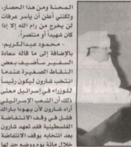
محمود عبدالكريم، السفير السعودي بتقدير من الدول العربية

المحنة ومن هنا الحصار، ولكنني أعلن أن ياسر عرفات لن يخرج من رام الله إلا إذا كان شهيداً أو منتصراً. محمود عبدالكريم، السفير السعودي بتقدير من الدول العربية بالرياض، إلى ما قاله سعادة السفير سفيث بعض النقاط الصغيرة عندما انتخب شارون ليكون رئيساً للوزراء في إسرائيل معني ذلك أن الشعب الإسرائيلي أراد شارون لأن يهودا باراك فشل في وقف الانتفاضة الفلسطينية فقد تهدد شارون خلال مائة يوم ووضع حد لها ولكن الانتفاضة استمرت ١٨ شهراً لأن عامل الخوف مما سيفعله شارون انتزع من صدور الناس ولم يعد يؤثر عليهم. تأتي إلى مبادرة ولي العهد صاحب السمو الملكي الأمير عبدالله بن عبدالعزيز هذه المبادرة جاءت لتضع حداً بعدما حدث في ١١ سبتمبر من اتهامات للحرب بالإرهاب إضافة إلى التدخل في الشؤون الداخلية للدول العربية والضغط عليها حتى الموقعة مورست عليها الضغوط وطلبت منها أمريكا تغيير مناهج التعليم فيها وتمتد الاتهامات إلى سورية واعتبرت دولة إرهابية وكذلك العراق التي تسمى مبادرتهم لتبث للعالم أجمع أننا دعاء هنا كانت الحاجة ملحة إلى أن يطرح سمو الأمير عبدالله بن عبدالعزيز ترتيب هذا العدوان المهجج الإيراني والنازي على الشعب الفلسطيني وافضل المبادرة لكي لا نبحث في تنفيذها ولا حراج إسرائيل وهي إذا الثار وعن إخراج ياسر عرفات من هذه المبادرة.