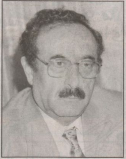
محمود عبدالكريم القائم بالأعمال السوري