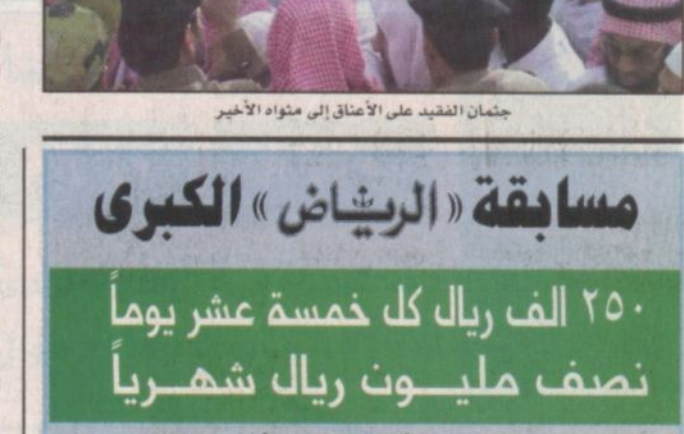
جثمان الفقيد على الأعتاق إلى مثواه الأخير

وقد شهدت جنازة الفقيد حضور أهل العلم والمعلمين الذين تواجدوا منذ الساعات الأولى حيث حضروا الصلاة عليه وساروا حتى مقابر العدل التي تبعد نحو سبعة كيلومترات. هذا وقد شهدت مقابر العدل حشوداً هائلة من محبي الفقيد يتقدمهم رئيس مجلس الشورى وأئمة الحرم المكي الشريف.. وقد خرج الجثمان الذي ووري الثرى بالعدل من المسجد الحرام عند الساعة الرابعة وعشرين دقيقة لتوجه إلى مثواه الأخير وسط لفيف المحبين وطلاب العلم.