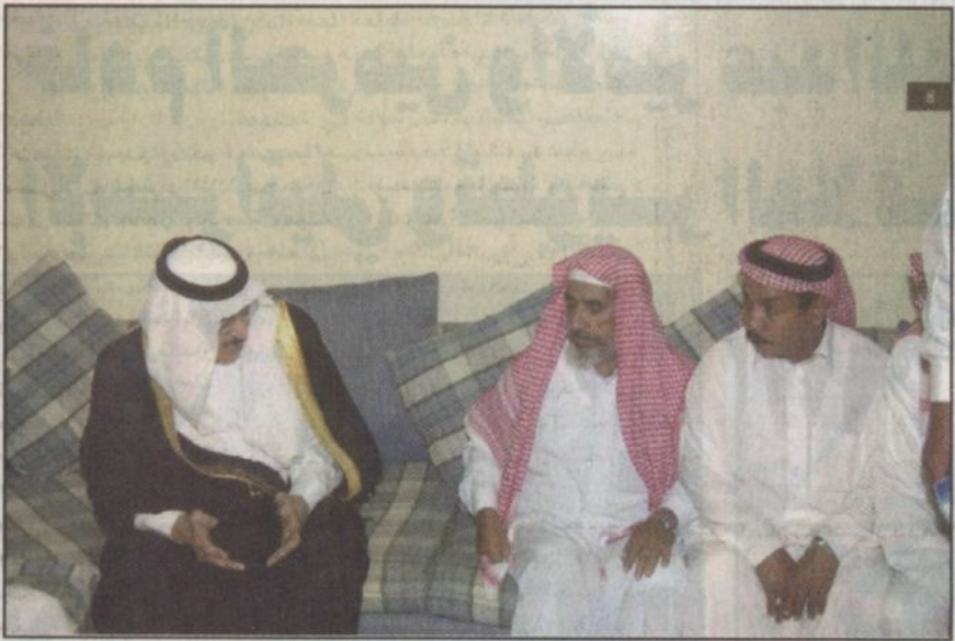
سمو في حوار أبوي مع عائلات الضحايا

جدة - واس: وخطيب المسجد الحرام وكدرنا ذلك أشد الكدر.. وأستاذاً في علم العقيدة واللاهوت والعلوم الشرعية والدراسات الإسلامية بجامعة أم القرى فضيلة الشيخ محمد بن عبد الله السبيل حفظه الله. ووجه صاحب السمو الملكي الأمير سلطان بن عبدالعزيز النائب الثاني لرئيس مجلس الوزراء وزير الدفاع والطيران والمفتش العام برفقة عزاء ومواساة لفضيلة الشيخ محمد بن عبد الله السبيل فيما يلي نصها: فضيلة الشيخ محمد بن عبد الله السبيل حفظه الله. السلام عليكم ورحمة الله وبركاته.. وبعد.. فقد بلغنا نبأ وفاة تـجـلـكـم الشيخ الدكتور عمر