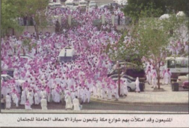
الشيعون وقد امتلأت بهم شوارع مكة يتابعون سيارة الاسعاف الحاملة للجثمان

وقد شهدت جنازة الفقيد حضور أهل العلم والمعلمين الذين تواجدوا منذ الساعات الأولى حيث حضروا الصلاة عليه وساروا حتى مقابر العدل التي تبعد نحو سبعة كيلومترات. هذا وقد شهدت مقابر العدل حشوداً هائلة من محبي الفقيد يتقدمهم رئيس مجلس الشورى وأئمة الحرم المكي الشريف.. وقد خرج الجثمان الذي ووري الثرى بالعدل من المسجد الحرام عند الساعة الرابعة وعشرين دقيقة لتوجه إلى مثواه الأخير وسط لفيف المحبين وطلاب العلم.