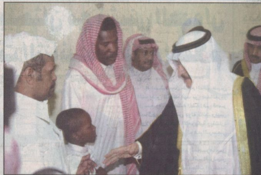
الأمير نايف يواسي الأثر