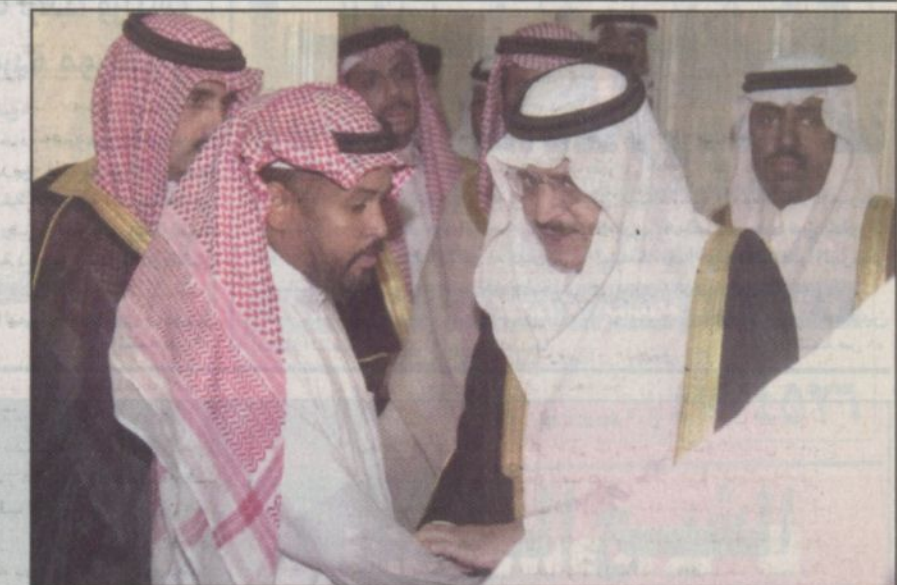
سمو يقدم التعازي لأسر الضحايا