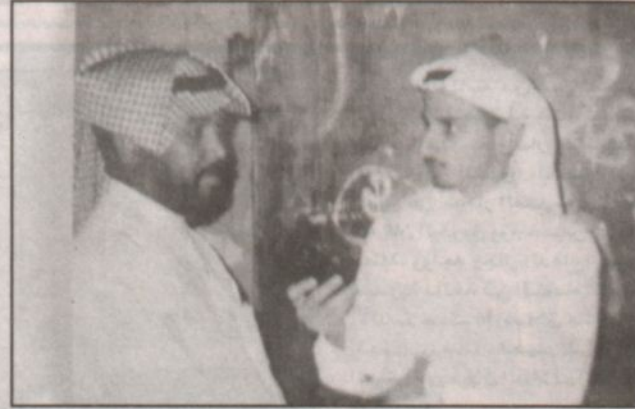
أحد المواطنين يتحدث للزميل الليبي

مكة المكرمة - سعود النفي ما زالت العاصمة المقدسة تعيش الفاجعة التي ألمت بإحدى مدارسها المتوسطة للبنات بحي الحادية والثلاثون (١٤) طالبة إلى متواهن الأخير بعد أن تفادعت الطالبات للخروج من المدرسة المنكوبة مما أدى إلى هذه الحادثة وإصابة أكثر من (٤٥) طالبة لا سيما وأنهن لم يتعرضن للحرق أو الاختناق، حيث كان السبب الرئيسي هو التدافع العشوائي لخروج الطالبات من هذا المبنى غير الصالح للمدرسة في وجهة نظر البعض، إذ يرض هذا المبنى نحو (٨٥٠) طالبة.