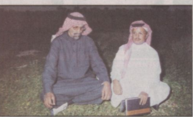
رئيس حماية الروضة الروبيخ يتحدث للزميل السهلي

ويطالب صالح أبا الخيل وإبراهيم الباطين بالوعي لدى الأسر للمحافظة على النظافة وعدم إلقاء الحطب، وللمسؤولين عن الحراسة جهوداً في منع التصوير بكاميرا الفيديو من قبل الشباب حفاظاً على الأسر ولكن مشكلة العزبات لتزورق الأسر وطالبون بان يخصص لهم جانباً من الروضة بدلاً من مضايقتهم للأسر. ويعد هذه دعوة لزيارة روضة خريم. وفي الختام نتقدم بالشكر للمسؤولين عن المحافظة على هذه الروضة وعلى رأسهم سمو الأمير سلمان بن عبدالعزيز أمير منطقة الرياض الحريص كل الخدمات للمواطنين وجعلهم يقضون يوماً جميلاً في احضان الطبيعة.