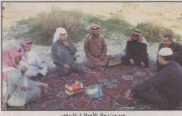
عدد من رجال الأعمال لـ الرياض