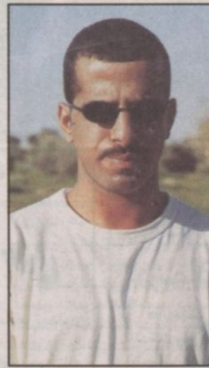
المهندس آل مشرف ومطالب لجذب السياح