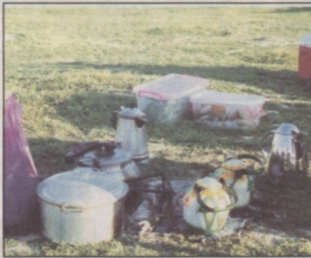
إيفاء النار بهذا الشكل يقضي على الأشجار