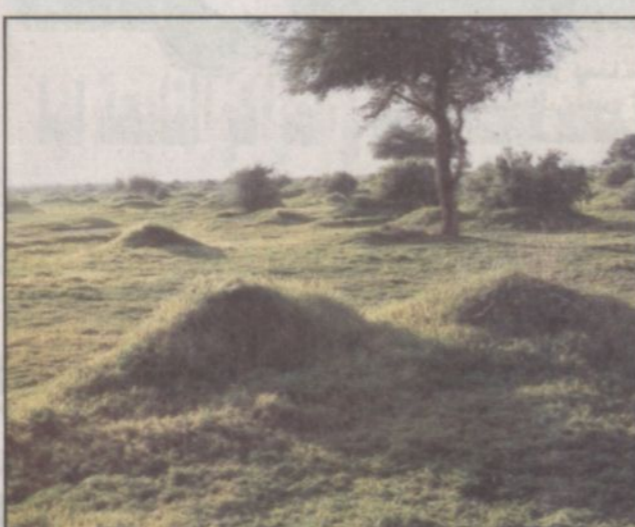
منظر ولا أروع في انتظار المنتزهين