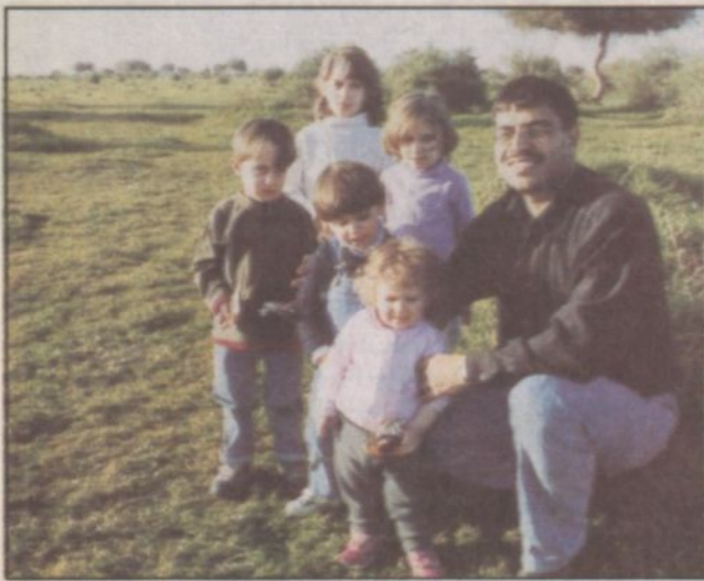
عائلة فلسطينية داخل الروضة