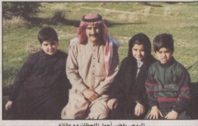
الرومي يقضي أجمل اللحظات مع عائلته