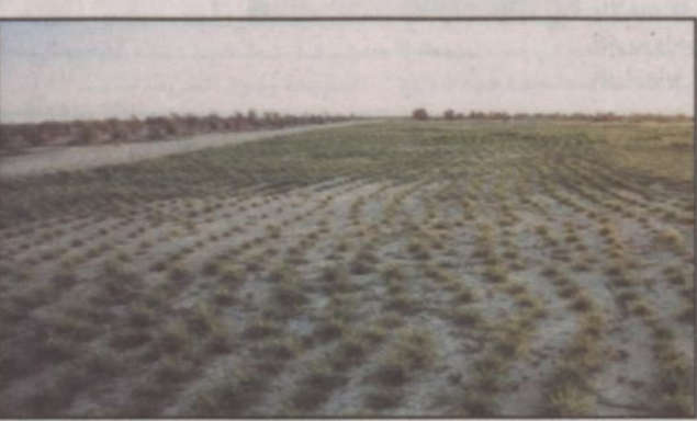
٢٠ ألف شجرة تمت زراعتها في الجهة الشرقية للروضة

خدمة للروضة وحمايتها وخدمة للمواطنين والمقيمين الذين يقضون أوقاتاً جميلة في الروضة وعدم مضايقتهم بل مساعدتهم قدر الإمكان وتهيئة الراحة لهم. ووجه الروبيخ شكره لسمو ولي العهد وسمو الأمير سلمان بن عبدالعزيز لاهتمامهم بالروضة وجعلها متنفساً سياحياً للأهالي ومرتباً للماشية بداية من شهر محرم من كل عام وفق أمر سمو الأمير سلمان بن عبدالعزيز عندما يوجه بذلك. روضة خريم تقع الروضة القريية من محافظة رماح على شكل مستطيل يبلغ محيطها ٤٠ كم من الصعب ان تجد لأسترك مكاناً يوماً الخميس والجمعة على الرغم من كبر حجم الروضة والتنظيم الرابع من قبل إدارة المجاهدين ساهم في عدم العبث بالأشجار وإبقاء الروضة نظيفة نظراً لوجود فرقتين للنظافة وحديقة ذلك لا تتعد بان هناك أعداداً كبيرة تطأ المسطحات الخضراء لساعات طويلة وتجدها نظيفة. وهناك جهود تبذل من قبل رجال المجاهدين وفرق النظافة ووزارة الزراعة التي قامت بغرس (٢٠) ألف شجرة من أشجار زيت