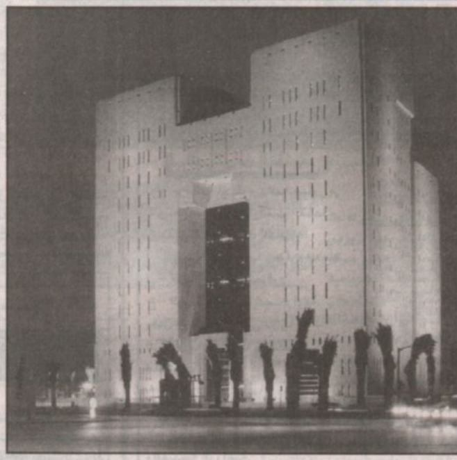
المبنى الجديد للمحكمة الكبرى سرح ضامح العدل في قلب الرياض.

الرياض، هذه لفحة كريمة من سمو الأمير عبدالله وقد اعتدنا من سموه النظرة الثاقبة والمواقف الحميدة، وما تقضل به سموه من توجيه لإعادة بناء المسجد الجامع القديم وضم أرض المحكمة القديمة والمناطق المجاورة له لإعادة بناء جامع الشيخ محمد بن إبراهيم رحمه الله وما سيراقد يعد مكرمة من سموه فله مني ومن أبناء جزييل الشكر والعرفان وحفظ الله خادم الحرمين وسمو النائب الثاني وقادة هذه البلاد والشكر والعرفان موصول لسمو الأمير سلمان بن عبدالعزيز لدعمه واهتمامه بالمياض بكل المشاريع الخيرة وكل ما له علاقة برفعة القضاء والعلم.