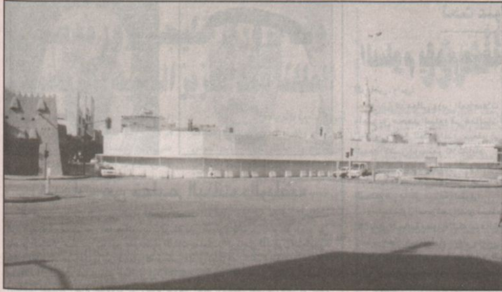
المبنى القديم للمحكمة الكبرى قبل الهدم بجوار دروازة الشمري يدخنة.