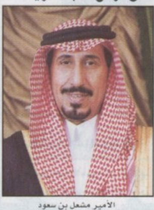
الأمير مشعل بن سعود

■ تمّن صاحب السمو الملكي الأمير مشعل بن سعود أمير منطقة نجران الرعاية الكريمة التي يحظى بها مهرجان الجنادرية كل عام وسباق الهجن من لدن سمو ولي العهد. وقال سموه في تصريح لـ «الرياض» إن سمو سيدي ولي العهد قد عودنا جميعاً على مثل هذه الرعاية الكريمة والدعم الكبير لابنائنا باستمرار. وأفاد سموه في سياق تصريحه أنه تم استلام أرض موقع منطقة نجران على أرض الجنادرية وتدرس حالياً إمكانية إقامة مبنى للمنطقة عليه في القريب إن شاء الله.