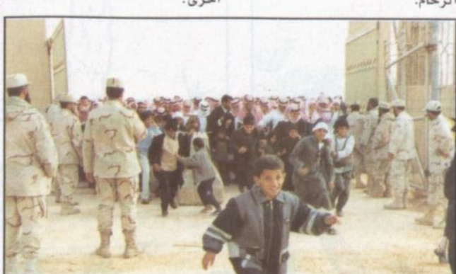
اندفاع كبير بسبب الزحام

■ شهد اليوم الأول لمهرجان الجنادرية السابع عشر أعداداً ضخمة من الزوار ومن مختلف الأعمار، وماكادت أن تفتح البوابات في تمام الساعة الثالثة والرابع إلا واندفعت أفواج الزوار بشكل سريع. وكان التنظيم أكثر من رائع بحيث سارت الأمور بشكل طبيعي، ولم يحصل أي مشاكل أو حوادث بسبب الزحام.