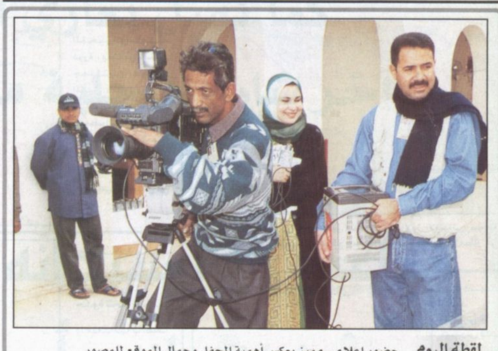
لقطة اليوم حضور إعلامي مميز يعكس أهمية الحفل وجمال الموقع للمصور

■ أكد وكيل الحرس الوطني للشؤون الثقافية والتعليمية نائب رئيس اللجنة التنفيذية للمهرجان الوطني للتراث والثقافة فيصل بن عبدالعزيز بن معمر أن المهرجان الوطني أحد الروافد المهمة في مسيرتنا الحضارية. وقال في تصريح صحفي إن النجاحات التي حققتها المهرجان الوطني للتراث والثقافة خلال السنوات الماضية كان له الأثر الكبير في التعريف بمنجزاتنا الحضارية ومعطياتنا التنموية التي وفرتها حكومة المملكة وفق خطط وبرامج مدروسة.