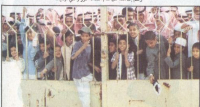
عدسة «الرياض» تصطاد أحد الأطفال بعد أن ندد صيروه

■ اصطفت حشود كبيرة من الزوار جاءت من كل مكان أمام بوابات قرية الجنادرية منذ وقت مبكر عصر أمس منتظرين لحظة فتح البوابات لزيارة المهرجان السنوي. وشهدت أعداد من الزوار من مختلف الأعمار من كبار سن وشباب والكثير من الأطفال، وعلى الرغم من برودة الجو يوم أمس إلا أن هذا لم يكن حائلاً دون ارتفاع أعداد الزوار، الذين أتوا من أجل المشاهدة والاستفادة والاستمتاع بكل ما يعرض في هذا المهرجان الوطني الكبير. (الرياض) تواجدت في الموقع قبل فتح البوابة ورصدت عدسة «الرياض» الكثير من القطعات المعبّرة والجميلة، فقد تم التقاط محاولة أحد الأطفال الدخول قبل فتح الأبواب فخطية بعد أن ندد صيروه، وكذلك نظرات بريئة تستعدي فتح البوابة، ولقطات عامة لجموع الزوار قبل الدخول.