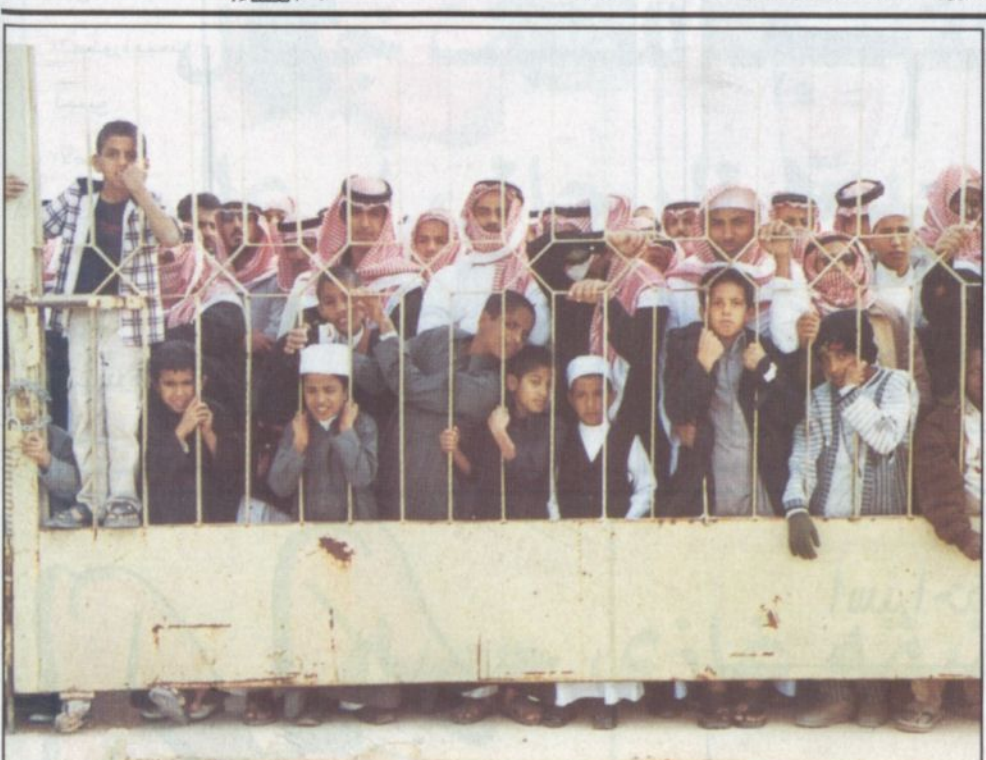
الزوار ولهفة الجنادرية (١٧)

■ يعرض جناح منطقة الحوف العديد من المنسوجات اليدوية والتي تعكس تراث المنطقة في فنون النسيج. ومن بين تلك المنسوجات قطعتان والنعتان يبرز من خلالهما فن الأداء ودقته، اللوحة الأولى لصاحب السمو الملكي الأمير عبدالله بن عبدالعزيز أثناء تأديته العرضة التجدية، والأخرى لصاحب السمو الملكي الأمير متعب بن عبدالله بن مسعود بكلمة حسان أبيض. هاتان القطعتان لفتتا وبشكل كبير أنظار الجمهور والزوار وأبدى الكثير منهم إعجابهم بهذا العمل.