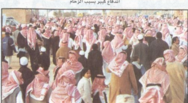
أعداد كبيرة من الزوار بعد الدخول للقرية