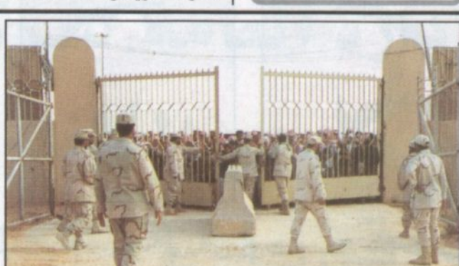
لحظة فتح البوابة