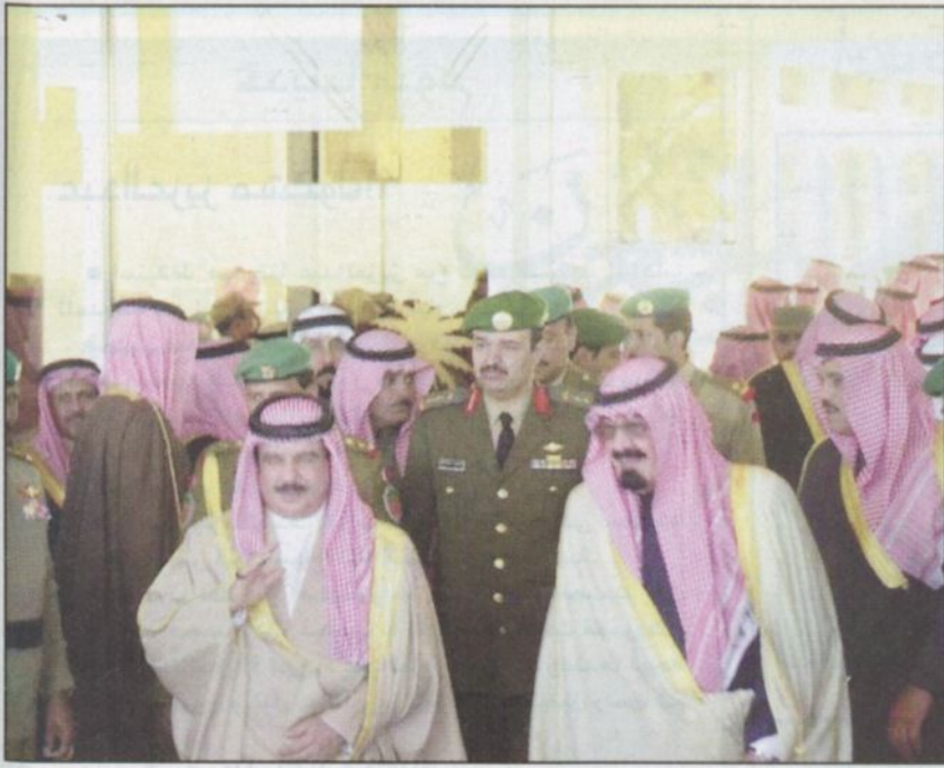
سمو أمير البحرين وسمو ولي العهد في افتتاح الجنادرية في الطريق إلى المنصة قبل عرض الأوبريت يوم أمس الأول

■ أشاد أمير دولة البحرين سمو الشيخ حمد بن عيسى آل خليفة بأوبريت (أنشودة العروبة) الغنائي الذي نظمته الحرس الوطني بمناسبة المهرجان الوطني السابع عشر للتراث والثقافة بالجنادرية وما تضمنه هذا الأوبريت من مضامين إنسانية ومعاني سامية تهدف إلى التضامن العربي وتؤكد على اللحمة الوجدانية وتطلعات الأمة العربية نحو التكاتف وروح الصوف مستعرضاً تاريخ المملكة العربية السعودية وإنجازاتها الحضارية. كما أشاد سموه بما تحظى به المملكة العربية السعودية من مشاركة فعالة في الساحة العالمية وجهودها على مختلف الأصعدة خليجياً وعربياً ودولياً ومواقفها الثابتة في خدمة الأمن والسلام الدوليين. كما أكد سمو أمير دولة البحرين في خيره بنته وكالة