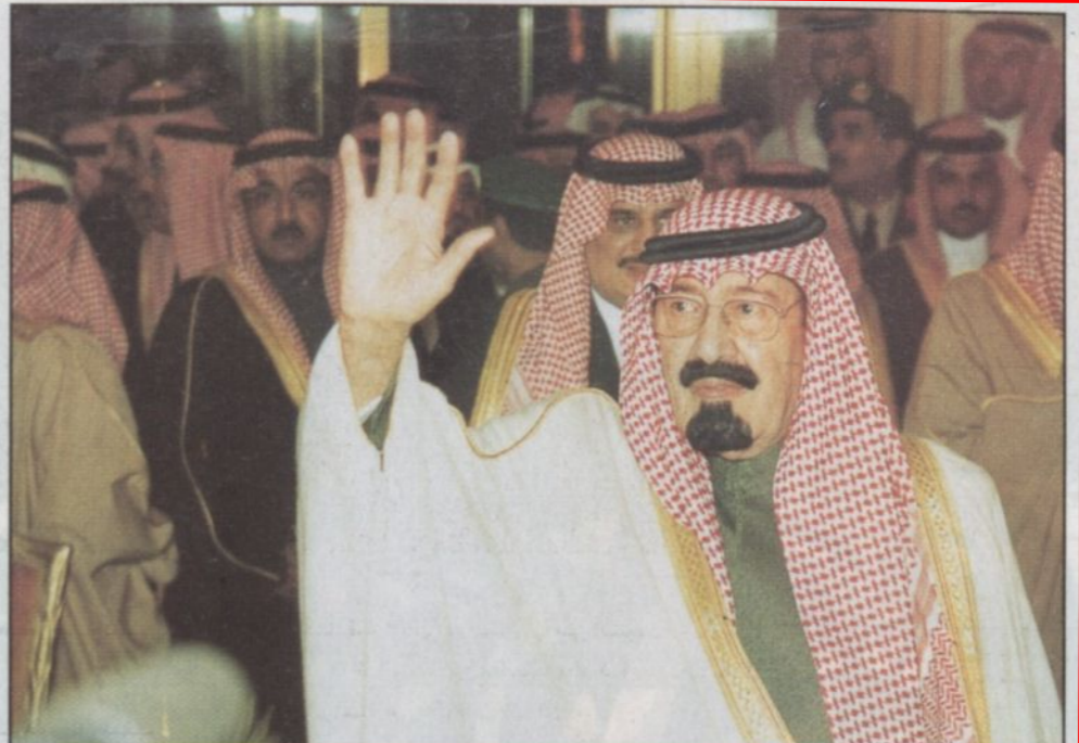
ولي العهد رعى افتتاح تجمع الأصدقاء