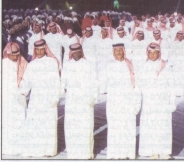
شباب المنطقة ما زال يدين لخالد الفيصل بمرحه لفكرة دورة الخليج