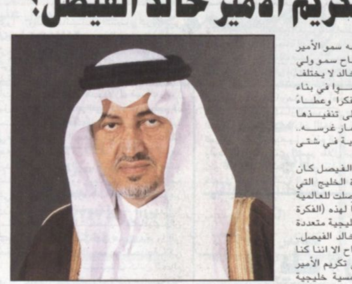
الأمير خالد الفيصل

كان للتكريم الكبير الذي حظي به سمو الأمير خالد الفيصل من راعي حفل الافتتاح سمو ولي العهد الأثر في نفوس الجميع فالأمير خالد لا يختلف اثنان على أنه من أوائل الذين ساهموا في بناء القاعدة الرياضية السعودية وأسهم فكرياً وعضواً في وضع استراتيجية عمل تعاقبت على تنفيذها أجيال متعديدة وما هو الآن يرى ثمار غرسه. تطورت مضطرد للرياضة السعودية في شتى الميادين.. ولعل اساس تكريم الأمير خالد الفيصل كان سببه الاول لكونه صاحب فكرة دورة الخليج التي سببها انطلقت الكرة الخليجية ووصلت للعالمية وأتت لسمة الوفاء لهذا الرجل تقديراً لهذه الفكرة الرائدة) والتي ستتحدث عنها أجيال خليجية متعددة وتقديراً وعرفاناً بجهود وفكر الأمير خالد الفيصل.. وبقدراً استمتعنا بحمال حفل الافتتاح الا اننا كنا فخورين ونحن نرى الوفاء يتجسد في تكريم الأمير خالد من قبل سمو ولي العهد في أسمة خليجية تاريخية فرأني أوافق وجهة نظر قائد المنتخب ساسي الجابر في هذا الشأن ولكن دعوني أشرح تساولاً عريضا مانا سيعمل أي منتخب خليجي لو أنه افتقد إلى خدمات نجوم كبار كعبدالله الشيبان وحسن عبدالغني ونواف التمياط وطلال المشعل وغيرهم في مدة زمنية قياسية وأرد أن سوى شخصيته ورفض الجوهري وصف أداء المنتخب السعودي (بالضعيف) مشيراً إلى أن اللاعبين قدموا مباراة كبيرة في الحصة الأولى وأداء متوازن نسبياً في النفاذ المتبقية من المباراة والأخطاء في عالم كرة القدم موجودة وبالتالي كث - ماجد التويجري ■ كرم - رحمه الله - تقديراً لما قدمه للرياضة العربية والخليجية في كل مناسبة تتجدد ذكرى فيصل بن فهد ■ كرم - رحمه الله - تقديراً لما قدمه للرياضة العربية والخليجية في كل مناسبة تتجدد ذكرى فيصل بن فهد