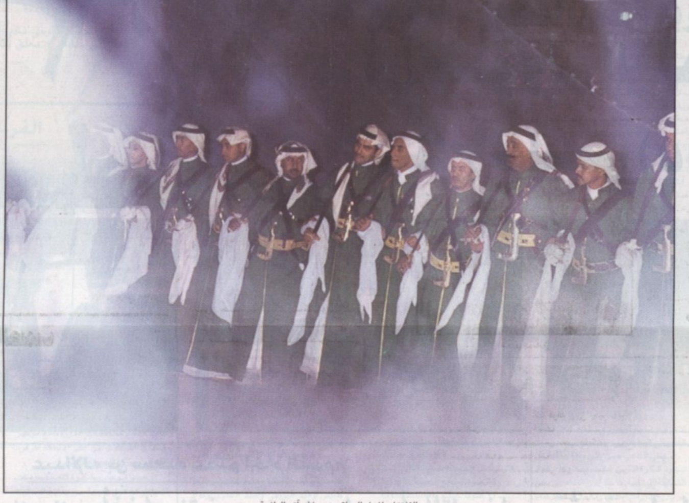
الافتتاح انزل المراقبين بمفاجآت الرائعة