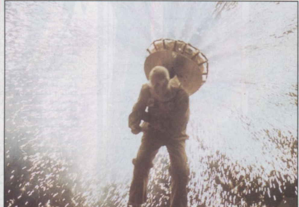
إحدى مفاجآت حفل الخليج الكبير