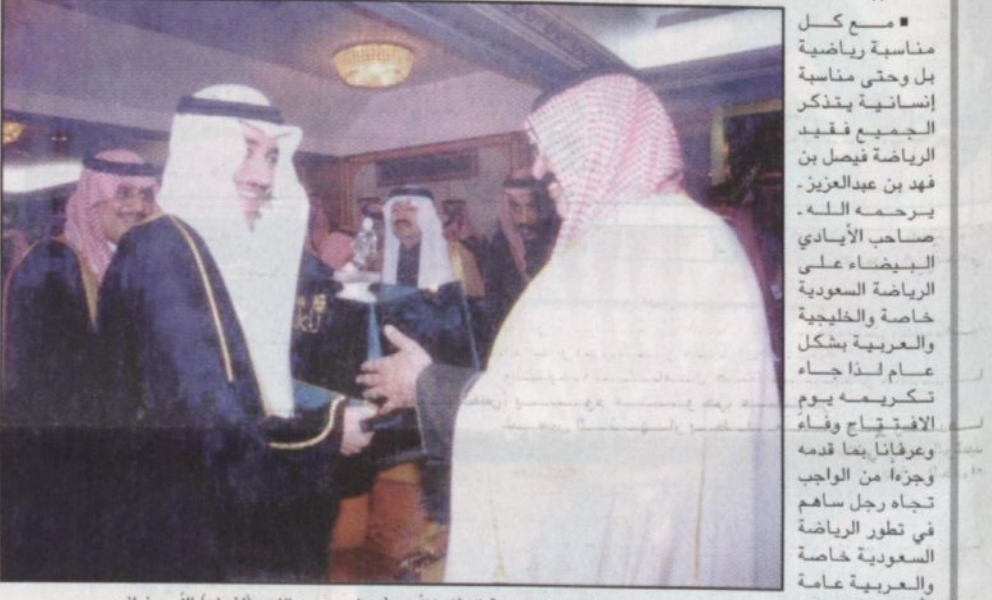
سمو ولي العهد يقدم هدية الوفاء للأمير فيصل - رحمه الله - (لتخله) الأمير نواف

مع كل مناسبة رياضية بل وحتى مناسبة إنسانية يتذكر الجميع فيصّل بن فهد بن عبدالعزيز - رحمه الله - صاحب الأمانى البيضاء على الرياضة السعودية خاصة والخليجية والعربية بشكل عام لذا جاء تكريمه يوم الافتتاح وفاء وعرفاناً بما قدمه وجزءاً من الواجب تجاه رجل ساهم في تطور الرياضة السعودية خاصة والعربية عامة وأوصلها إلى العالمية من خلال دعم متواصل وجهد ومتابعة، وكان سموه - رحمه الله - لا يألو جهداً في تذليل كل الصعاب التي تواجه تقدم الرياضة السعودية والعربية من خلال متابعته واتصاله وكان من الطبيعي أن نترجم أقواله وأفعاله - رحمه الله - لإنجازات للرياضة السعودية في كافة الألعاب وعلى مستوى المنتخبات مع كل مناسبة رياضية بل وحتى مناسبة إنسانية يتذكر الجميع فيصّل بن فهد بن عبدالعزيز - رحمه الله - صاحب الأمانى البيضاء على الرياضة السعودية خاصة والخليجية والعربية بشكل عام لذا جاء تكريمه يوم الافتتاح وفاء وعرفاناً بما قدمه وجزءاً من الواجب تجاه رجل ساهم في تطور الرياضة السعودية خاصة والعربية عامة وأوصلها إلى العالمية من خلال دعم متواصل وجهد ومتابعة، وكان سموه - رحمه الله - لا يألو جهداً في تذليل كل الصعاب التي تواجه تقدم الرياضة السعودية والعربية من خلال متابعته واتصاله وكان من الطبيعي أن نترجم أقواله وأفعاله - رحمه الله - لإنجازات للرياضة السعودية في كافة الألعاب وعلى مستوى المنتخبات