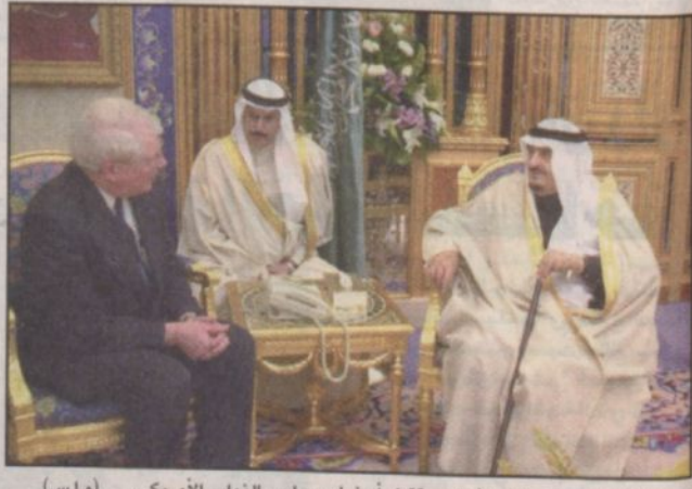
خادم الحرمين الشريفين يستقبل أعضاء مجلس النواب الأمريكي

الرياض - واس استقبل خادم الحرمين الشريفين الملك فهد بن عبدالعزيز آل سعود بمكتبه في قصر اليمامة أمس صاحب السمو الشيخ خليفة بن سلمان آل خليفة رئيس الوزراء بدولة البحرين الشقيقة والوفد المرافق له. وقد عقد خادم الحرمين الشريفين وأخوه سمو الشيخ خليفة بن سلمان آل خليفة جلسة مباحثات نقل في مستهلها سمو رئيس وزراء دولة البحرين للملك المعدي تحيات وتقدير أخويه صاحب السمو الشيخ حمد بن عيسى آل خليفة أمير دولة البحرين وسمو ولي عهده الشيخ سلمان بن حمد آل خليفة. كما جرى خلال الجلسة بحث آفاق التعاون «التقمة ص ٨»