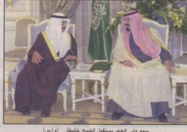
سمو ولي العهد يستقبل الشيخ خليفة

الرياض - واس عقد صاحب السمو الملكي الأمير عبدالله ولي العهد ونائب رئيس مجلس الوزراء ورئيس الحرس الوطني وأخوه صاحب السمو الشيخ خليفة بن سلمان آل خليفة رئيس الوزراء بدولة البحرين الشقيقة جلسة مباحثات «التقمة ص ٨»