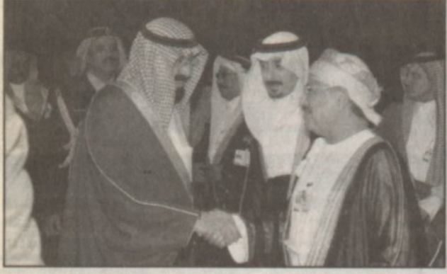
مغادرة الأمير عبدالله مسقط