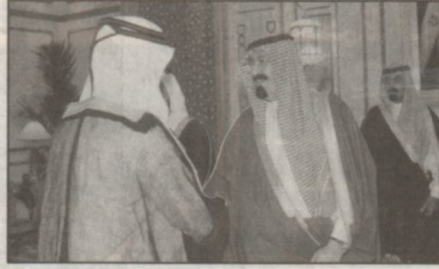
مغادرة سمو ولي العهد أبوظبي