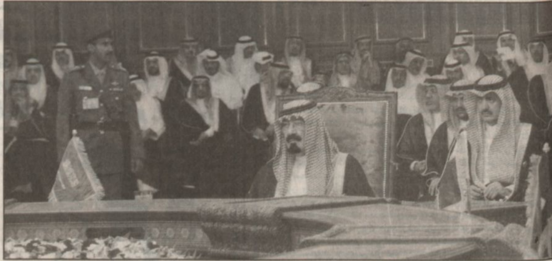
لقطة للقاعة من الجلسة الافتتاحية للقمة الخليجية (وأس)