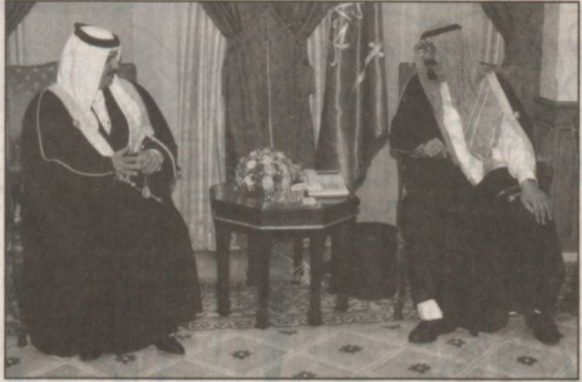
سمو ولي العهد مستقبلاً أمير البحرين على هامش أعمال القمة (وأس)