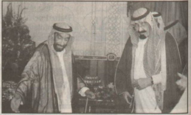
الشيخ زايد يستقبل الأمير عبدالله