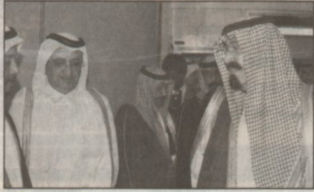
وصول سمو ولي العهد إلى أبوظبي