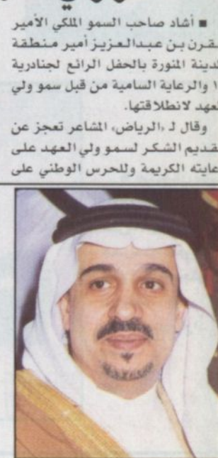
الأمير فيصل بن بندر

تميزه بتقديم هذه التظاهرة الثقافية الرائعة. وأثنى سموه على ما شاهدته في بيت حائل من معروضات وسوق شعبي وقال إنه تحفة تراثية جميلة. وتسنى سموه أن يستفيد من الجنادرية في السياحة وأن يخصص نهاية الأسبوع لزيارتها لدعم برامج السياحة.