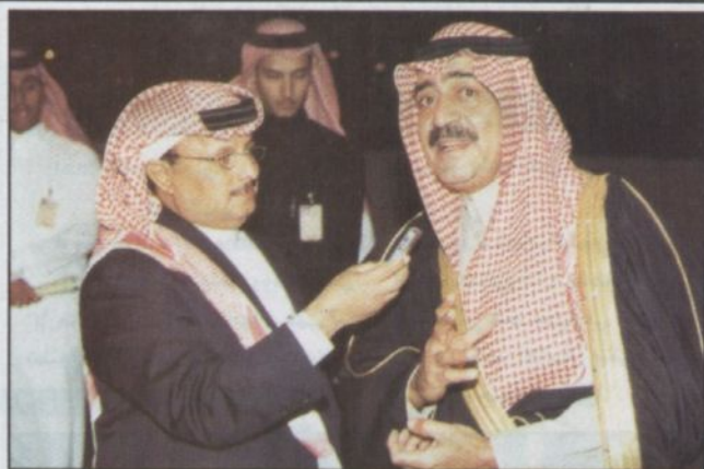
الأمير مقرن يتحدث للزميل السهلي