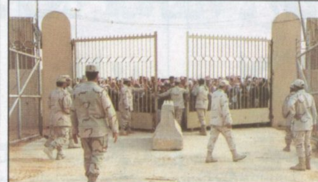
لحظة فتح البوابة