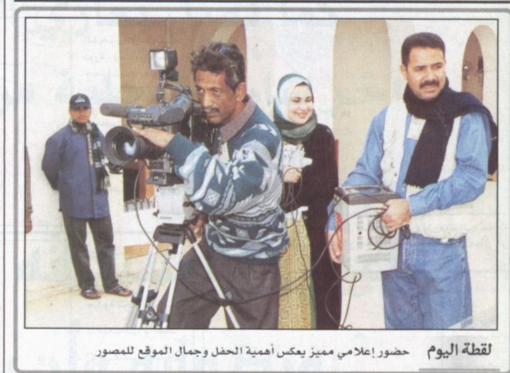
لقطة اليوم حضور إعلامي مميز يعكس أهمية الحفل وجمال الموقع للمصور

■ أكد وكيل الحرس الوطني للشؤون الثقافية والتعليمية نائب رئيس اللجنة التنفيذية للمهرجان الوطني للتراث والثقافة فيصل بن عبدالعزيز بن معمر أن المهرجان الوطني أحد الروافد المهمة في مسيرتنا الحضارية. وقال في تصريح صحفي إن النجاحات التي حققتها المهرجان الوطني للتراث والثقافة خلال السنوات الماضية كان له الأثر الكبير في التعريف بمنجزاتنا الحضارية ومعطياتنا التنموية التي وفرتها حكومة المملكة وفق خطط وبرامج مدروسة.