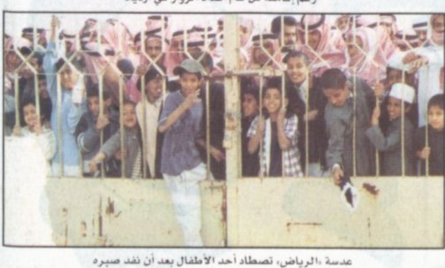
عدسة «الرياض» تصطاد أحد الأطفال بعد أن نفذ صبره

■ اصطففت حشود كبيرة من الزوار جاءت من كل مكان أمام بوابات قرية الجنادرية منذ وقت مبكر عصر أمس منتظرين لحظة فتح البوابات لزيارة المهرجان السنوي. وشهدت أعداد من الزوار من مختلف الأعمار من كبار سن وشباب والكثير من الأطفال، وعلى الرغم من برودة الجو يوم أمس إلا أن هذا لم يكن حاجلاً دون ارتفاع أعداد الزوار، الذين أتوا من أجل المشاهدة والاستفادة والاستمتاع بكل ما يعرض في هذا المهرجان الوطني الكبير. (الرياض) تواجدت في الموقع قبل فتح البوابة ورصدت عدسة «الرياض» الكثير من القطعات المعبّرة والجميلة، فقد تم التقاط محاولة أحد الأطفال الدخول قبل فتح الأبواب فخطى بعد أن نفذ صبره، وكذلك نظرات بريئة تستعدي فتح البوابة، ولقطات عامة لجموع الزوار قبل الدخول.