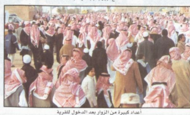
أعداد كبيرة من الزوار بعد الدخول للقرية