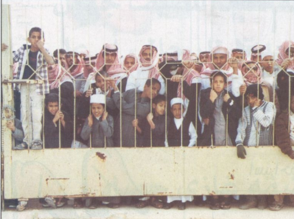
الزوار ولهفة الجنادرية (١٧)

■ قال صاحب السمو الملكي الأمير الفريق أول ركن متعب بن عبدالله بن عبدالعزيز نائب رئيس الحرس الوطني المساعد للشؤون العسكرية نائب رئيس اللجنة العليا المنظمة للمهرجان أنه شرف عظيم لنا ولزملائنا أن تكون في رعاية سمو سيدي ولي العهد نيابة عن مولاي خادم الحرمين الشريفين والحمد لله أن الافتتاح انتهى على الوجه المطلوب وحسبما خطط له وخرجنا بمظهر مختلف من الأوبريتات الماضية. وأضاف سموه لـ «الرياض»: الحمد لله قد تلاهنا مشاكل الصوت والصدي داخل صالة العروض بحيث تمت دراستها وإيجاد المعالجة لها مسرحياً وتلفزيونياً واستطاعوا القضاء على الصدى وأبدع في الإخراج التلفزيوني والمسرحي. وعن تجربة الإخراج العربي والإخراج الأوروبي وإيهما الأفضل قال سموه: التجارب جميعها ناجحة ولكن وجهة نظره الخاصة ونحن دائماً نسعى للتجديد في كل عمل فني والحمد لله هناك تغيير والمخرج نجحت أنزور عمل عملاً جباراً ويستحق