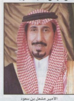
الأمير مشعل بن سعود

■ تمّن صاحب السمو الملكي الأمير مشعل بن سعود أمير منطقة نجران الرعاية الكريمة التي يحظى بها مهرجان الجنادرية كل عام وسباق الهجن من لدن سمو ولي العهد. وقال سموه في تصريح لـ «الرياض» إن سمو سيدي ولي العهد قد عودنا جميعاً على مثل هذه الرعاية الكريمة والدعم الكبير لابنائنا باستمرار. وأفاد سموه في سياق تصريحه أنه تم استلام أرض موقع منطقة نجران على أرض الجنادرية وتدرس حالياً إمكانية إقامة مبنى للمنطقة عليه في القريب إن شاء الله.