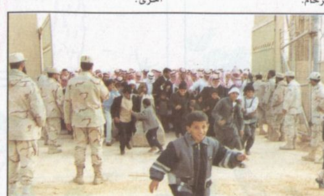
اندفاع كبير بسبب الزحام

■ شهد اليوم الأول لمهرجان الجنادرية السابع عشر أعداداً ضخمة من الزوار ومن مختلف الأعمار، وماكادت أن تفتح البوابات في تمام الساعة الثالثة والرابع إلا واندفعت أفواج الزوار بشكل سريع. وكان التنظيم أكثر من رائع بحيث سارت الأمور بشكل طبيعي، ولم يحصل أي مشاكل أو حوادث بسبب الزحام.