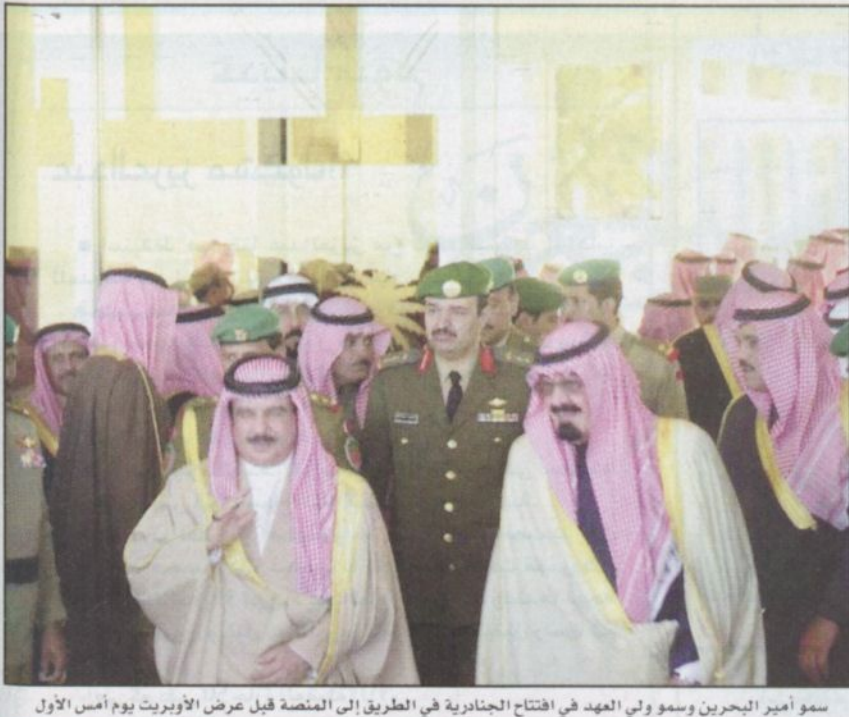
سمو أمير البحرين وسمو ولي العهد في افتتاح الجنادرية في الطريق إلى المنصة قبل عرض الأوبريت يوم أمس الأول

■ أشاد أمير دولة البحرين سمو الشيخ حمد بن عيسى آل خليفة بأوبريت (أنشودة العروبة) الغنائي الذي نظمته الحرس الوطني بمناسبة المهرجان الوطني السابع عشر للتراث والثقافة بالجنادرية وما تضمنه هذا الأوبريت من مضامين إنسانية ومعاني سامية تهدف إلى التضامن العربي وتؤكد على اللحمة الوجدانية وتطلعات الأمة العربية نحو التكاتف وروح الصوف مستعرضاً تاريخ المملكة العربية السعودية وإنجازاتها الحضارية. كما أشاد سموه بما تحظى به المملكة العربية السعودية من مشاركة فعالة في الساحة العالمية وجهودها على مختلف الأصعدة خليجياً وعربياً ودولياً ومواقفها الثابتة في خدمة الأمن والسلام الدوليين. كما أكد سمو أمير دولة البحرين في خيره بنته وكالة