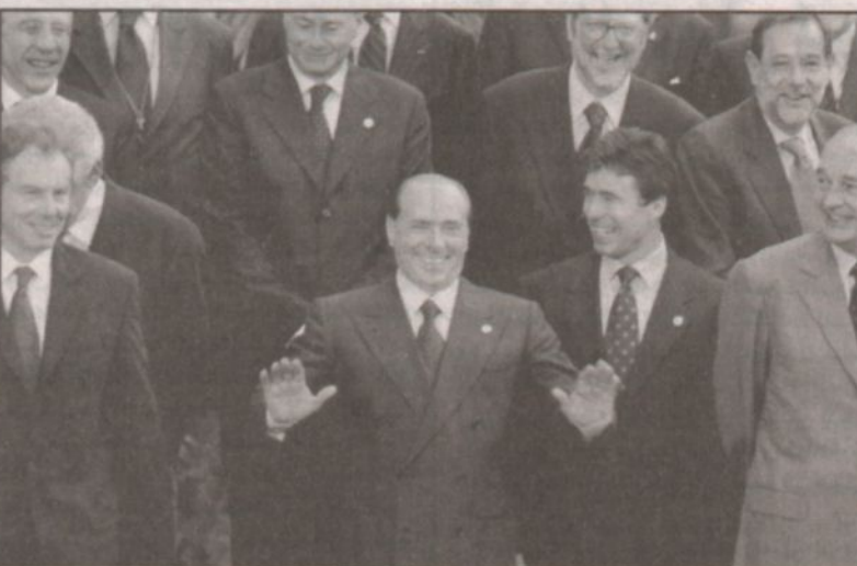
رئيس الوزراء الإيطالي بيرونو يبرونو يلوح للصحافيين خلال القمة الأوروبية امس

برشلونة، لندن - اف ب، رويترز: برشلونة، لندن - اف ب، رويترز: اجتمع عقد في برشلونة اعلانا يدعو الى تطبيق (عاجل) لقرار مجلس الامن الدولي رقم ١٣٩٧ الذي يشير الى دولة فلسطينية، ولرفع كل القيود المفروضة على تحرك الرئيس الفلسطيني ياسر عرفات.