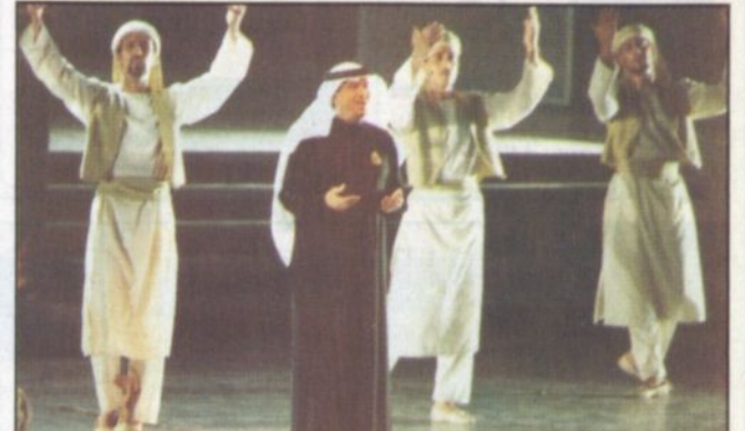
ملحن الاوبريت محمد عبده يفتي أحد مقاطعه