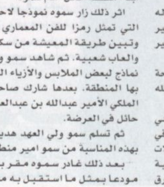
ولي العهد يودع الحضور

في تغيير مظاهر الحياة الاجتماعية والاقتصادية والعلمية والفكرية وفي فترة قياسية جعلت من المملكة نموذجا فريدا في سرعة النمو والتطور بين دول العالم.. و اضاف معاليه قائلا، لعل من أبرز معالم السياسة الاقتصادية لعائد هذه المسيرة المباركة. أمد الله في عمره تبني استراتيجية توسيع القاعدة الاقتصادية وتعزيز روافدها من خلال تمكين مجتمع الأعمال في المملكة من القيام بدور محوري في حقول التنمية الاقتصادية والاجتماعية وتشجيع مبادراته الخلاقة وتعميق مفهوم الحقيقة بين القطاعين العام والخاص.. وتابع معاليه يقول، وقد تجلت هذه الرعاية الكريمة فيما نحقق لقطاع الأعمال في هذا العهد الزاهر من