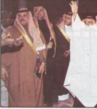
ولي العهد يودع الحضور

بضرورة الاستثمار في وطنه وثقة مطلقة في أمن واستقرار بلاده وقدرتها على استيعاب ورعاية مبادراته الخلاقة وحماية مكتسباته.. اشر ذلك القبي الدكتور عبدالرحمن العشاوي قصيدة شعرية نالت استحسان الحضور. بعدما التقى العميد خلف بن هذال العتيبي قصيدة نبطية. وذلك بشرف بالسلام على سمو الامير عبدالله بن عبدالعزيز المشاركون في هذا الاوبريت من فنانين مؤدبين ومخرج وملحن الاوبريت ومطابق العمل.