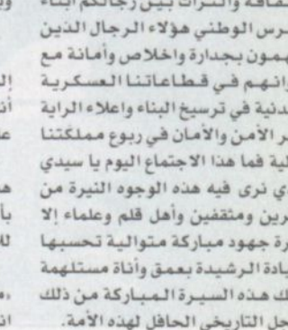
ولي العهد يودع الحضور

في تغيير مظاهر الحياة الاجتماعية والاقتصادية والعلمية والفكرية وفي فترة قياسية جعلت من المملكة نموذجا فريدا في سرعة النمو والتطور بين دول العالم.. و اضاف معاليه قائلا، لعل من أبرز معالم السياسة الاقتصادية لعائد هذه المسيرة المباركة. أمد الله في عمره تبني استراتيجية توسيع القاعدة الاقتصادية وتعزيز روافدها من خلال تمكين مجتمع الأعمال في المملكة من القيام بدور محوري في حقول التنمية الاقتصادية والاجتماعية وتشجيع مبادراته الخلاقة وتعميق مفهوم الحقيقة بين القطاعين العام والخاص.. وتابع معاليه يقول، وقد تجلت هذه الرعاية الكريمة فيما نحقق لقطاع الأعمال في هذا العهد الزاهر من