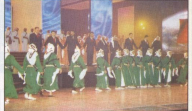
نجوم، أنشودة العروبة.