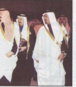
ولي العهد يودع الحضور

بضرورة الاستثمار في وطنه وثقة مطلقة في أمن واستقرار بلاده وقدرتها على استيعاب ورعاية مبادراته الخلاقة وحماية مكتسباته.. اشر ذلك القبي الدكتور عبدالرحمن العشاوي قصيدة شعرية نالت استحسان الحضور. بعدما التقى العميد خلف بن هذال العتيبي قصيدة نبطية. وذلك بشرف بالسلام على سمو الامير عبدالله بن عبدالعزيز المشاركون في هذا الاوبريت من فنانين مؤدبين ومخرج وملحن الاوبريت ومطابق العمل.