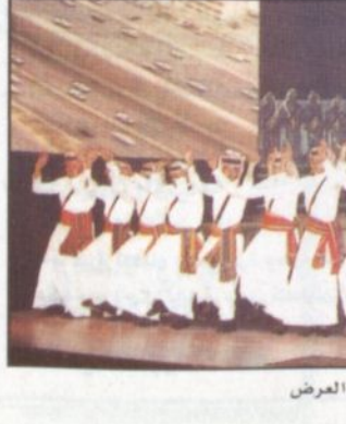
مشهد من الانتاشة

الدراما لعبت دورها أيضا عبر مشهد قصير أراه الفنان السوري رشيد عساف وتقمص فيه شخصية القائد المهلم البطل (صلاح الدين الأيوبي) وذلك ضمن لوحة حطين، وقد جاءت فكرة هذا المشهد انطلاقاً من مسلسل (البحث عن صلاح الدين) الذي لعب عساف بطولته وأخرجه أيضاً أنزور وكتبه محمود عبدالكريم الكاتب السياسي والدراسي السوري، وهو أيضاً كاتب مسلسل (البحث عن صلاح الدين).. قد وضع المؤثرات الصوتية لهذا المشهد الفنان الأردني وليد الهشيم. طبيعة العمل فرضت تعاملاتاً مختلفاً وتوظيفاً مغايراً في جانب الإضاءة وشاشات الليزر الخلفية. فخلخليات المسرح شغلت بمجموعة شاشات العروض المختلفة الأحجام وأسفخت عليها مشاهد مساندة لتفزيونية وسينمائية من وحى كل لوحة. الإضاءة كانت تعبيرية ايجالية أكثر من استخدامها بشكل استعراضي إيهاري.