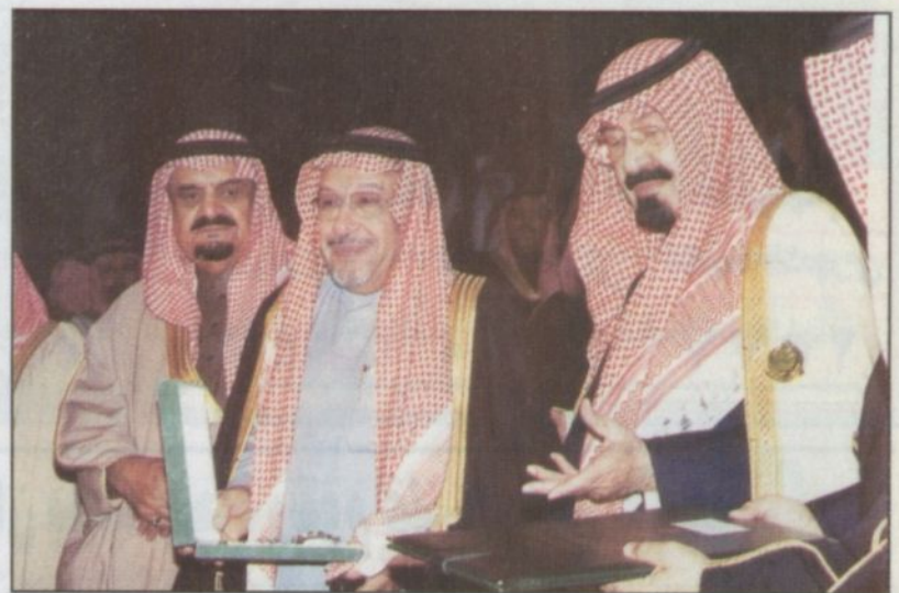
الأمير عبدالله يسلم عبدالرحمن فقيه وسام الملك عبدالعزيز

في ليلة من ليالي المجد التراثي والحضاري طرّزها حضور رجالات السياسة والفكر والفن العربي