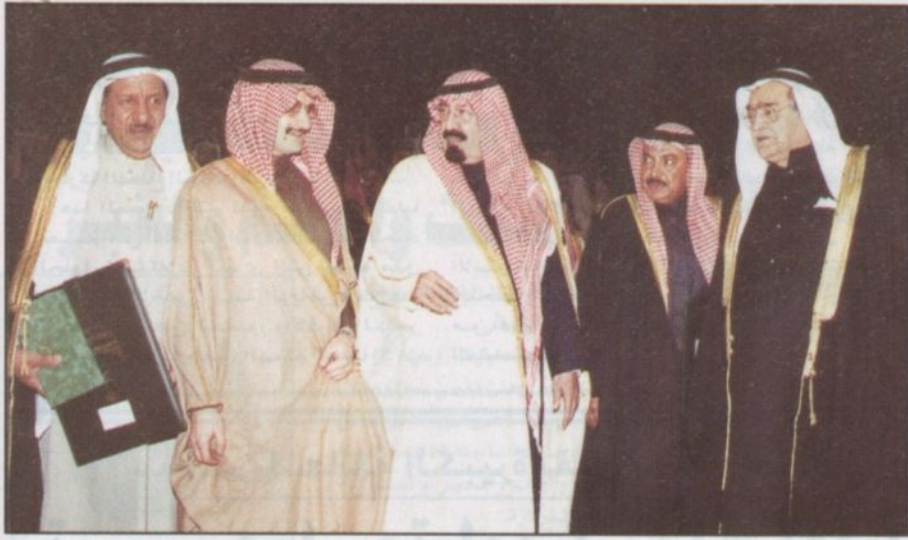
الأمير عبدالله في لحظة تذكارية مع رجال الأعمال الأمير الوليد وكامل والخريف والجبر