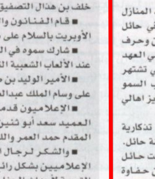
ولي العهد يودع الحضور

في تغيير مظاهر الحياة الاجتماعية والاقتصادية والعلمية والفكرية وفي فترة قياسية جعلت من المملكة نموذجا فريدا في سرعة النمو والتطور بين دول العالم.. و اضاف معاليه قائلا، لعل من أبرز معالم السياسة الاقتصادية لعائد هذه المسيرة المباركة. أمد الله في عمره تبني استراتيجية توسيع القاعدة الاقتصادية وتعزيز روافدها من خلال تمكين مجتمع الأعمال في المملكة من القيام بدور محوري في حقول التنمية الاقتصادية والاجتماعية وتشجيع مبادراته الخلاقة وتعميق مفهوم الحقيقة بين القطاعين العام والخاص.. وتابع معاليه يقول، وقد تجلت هذه الرعاية الكريمة فيما نحقق لقطاع الأعمال في هذا العهد الزاهر من