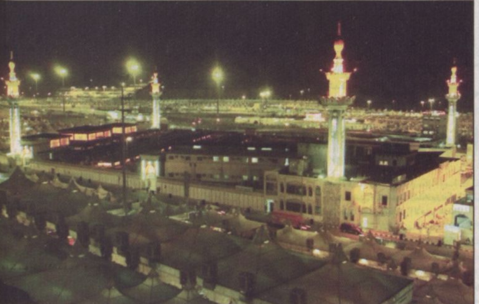
مسجد الخيف في منى حيث يقضي الحجاج أيام التشريق هناك

نجاح المرحلة الثانية وكانت قوافل حجاج بيت الله الحرام قد تمكنت من الوقوف يوم أمس المبارك على صعيد عرفات الله