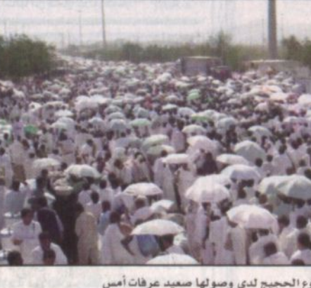
جموع الحجيج لدى وصولها صعيد عرفات أمس