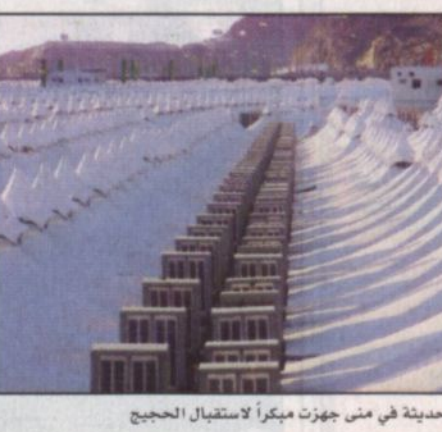
حجاج حديثة في منى جهزت ميكراً لاستقبال الحجيج

الاستقبال أي حالة مرضية للحجاج إضافة إلى تكتيف المراكز العاملة بالمشعرين بكامل التجهيزات التي يحتاجونها إضافة إلى أن الوزارة تقوم بتجهيز فريق طبي لمساعدة الججاج المرضى الملازمين للسبر الأبيض حتى تمكنهم من الوقوف بعرفات مؤكداً معاليه الحالة الصحية التي ينعم بها ضيوف الرحمن جيدة.