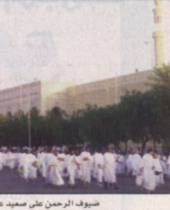
ضيوف الرحمن على صعيد عرفات الطاهر

من أمور الفتنة والفساد. ومطالب سماحة الشيخ عبدالعزيز بن عبدالله آل الشيخ دعاة الاسلام بالتحكم والبصيرة والتعاون والتكاتف في هذا المجال والحد من اعداء الاسلام الذين يحاولون احباط جهودهم. وحث علماء المسلمين على تقوى الله في انفسهم والحرس على جمع كلمة الأمة والابتعاد عن كل من يحاول تفرقة هذه الأمة. ودعا قادة المسلمون من اداء فريضة الحج في يسر وأمان. ورفع سماحة مفتي عام المملكة أصف الضراعة إلى الله سبحانه وتعالى بأن يفيق البلاد وان يحفظ لها أمنها واستقرارها وان يحفظ خادم الحرمين الشريفين سمو ولي عهد الأمين سمو النائب الثاني ويوفهم لكل خير منها بكل ما قدمته هذه البلاد لحجاج بيت الله الحرام.