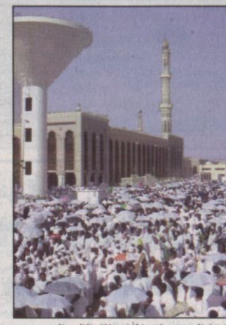
ضيوف الرحمن يستعدون لأداء صلاتي الظهر والعصر جمعاً وقصراً أمس في عرفات

الحمد مطمئنة. فيما أكد معالي وزير الحج والمشاريع المقدسة - بعثة «الرياض»