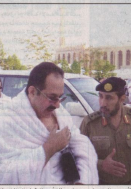
الأمير عبدالمجيد لدى وصوله عرفات أمس للوقوف على الخدمات المقدمة لضيوف الرحمن

أوقات قياسية من جانبه أعلن صاحب السمو الملكي الأمير عبدالمجيد بن عبدالعزيز أمير منطقة مكة المكرمة رئيس لجنة الحج المركزية نجاح خطة تصعيد قوافل الحجيج إلى صعيد عرفات الطاهر للوقوف على