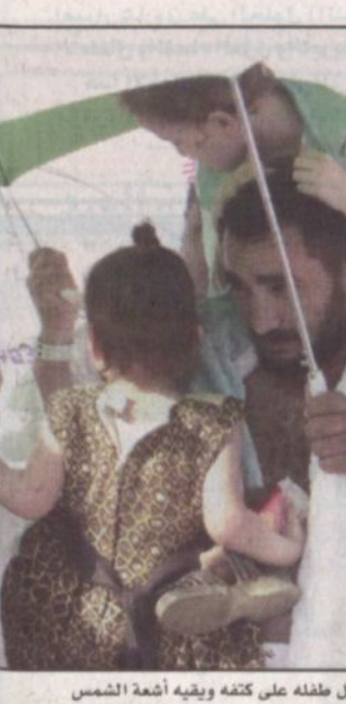
حاج يحمل طفله على كتفه ويقبه أشعة الشمس

تصعيد حجاج بيت الله الحرام على مدار الساعة واعطاء التقارير أولاً بأول إلى غرف العمليات التي تقوم بدورها بالتوجيه والمتابعة لتدليل أي عتية قد تقابل حركة التصعيد. «الرياض» شهدت هذه التطلعات المستمرة والمهمة وكأدى الخطط المنفذة في حج هذا العام ١٤٢٢ التي تعتبر ذات دور حيوي في نجاح هذا التصعيد إضافة إلى انتشار رجال الأمن في الطرقات والميادين. وكان التضافر هذه الجهود مميز في حركة رحلة الحجاج على الصعيبة بين الحجاج ممتازة ولم ترد أي بلاغات تفيد بوجود أي حالات وأنيابية أو وقوع حوادث مرورية أو أمانية لا سيج الله ولله الحمد والمنة متسداً سموه على ضرورة التفاني والإخلاص من الجميع لخدمة حجاج بيت الله الحرام. وفي ختام تصريح سموه هنا