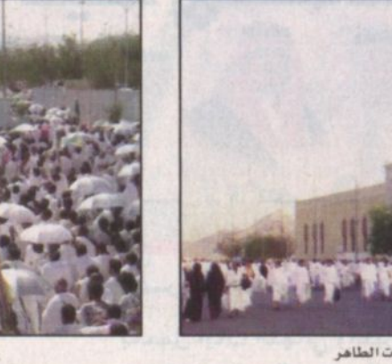
جموع الحجيج لدى وصولها صعيد عرفات أمس