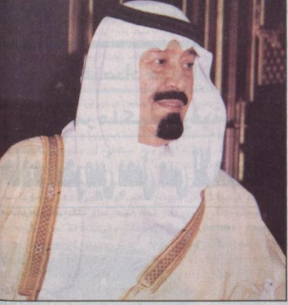
الأمير عبدالله بن عبدالعزيز

مكة المكرمة - خالد الزيدان، يقوم صاحب السمو الملكي الأمير عبدالله بن عبدالعزيز ولي العهد نائب رئيس مجلس الوزراء، رئيس الحرس الوطني مساء اليوم الجمعة أول أيام عيد الأضحى المبارك بزيارة مقر مخيمات الحرس الوطني بمنى، ويفتح سموه المعرض الذي ينظمه جهاز الإرشاد والتوجيه بالحرس الوطني المقام بالمخيم التابع للجهاز والذي يشمل العديد من الصور والبيانات والرصد لأنشطة الجهاز بالحج إضافة للمعرض المصاحب عن «الاعجاز العلمي»، كما يتشرف أصحاب المعالي والفضيلة العلماء والمشايخ المشاركين مع الجهاز بالسلام على سموه وتهنئته بعيد الأضحى المبارك.