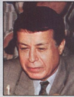
السفير/ محمد صبيح

د. أحمد يوسف: ما تقوم به المملكة يؤكد عزمها الاستمرار في خدمة دأمة لقضايا أمتها