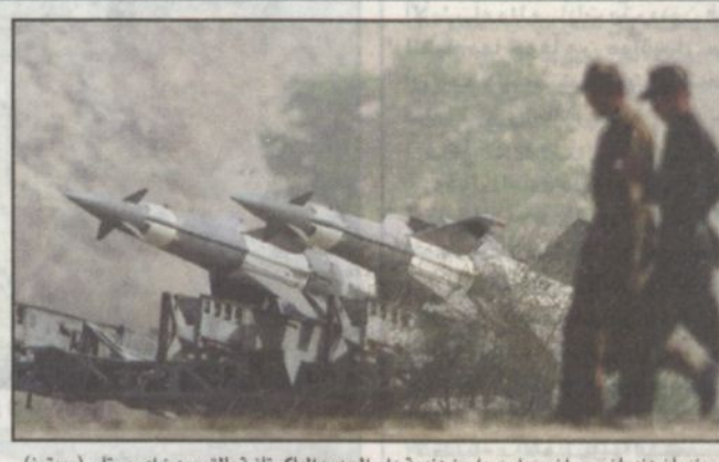
جنديان هنديان يسيران بجوار صواريخ هندية على الحدود الباكستانية بالقرب من امريستار.

باكستان، وهذا ما لا شك فيه الية، متمهما الهند بأنها تريد الدفاع فقط عن مكانتها الرفيعة الشأن في جنوب آسيا. وقال ايضا بيريدون باكستان تحت السيطرة وان تبقى تحت سيطرتهم. وأضاف «نريد العيش بسلام وضمان حفظ سيادتنا وشرفنا وكرامتنا، موضحا ان نسامو على ذلك ابدا». ودعا الرئيس الباكستاني ايضا الى تعزيز وجود الامم المتحدة في المنطقة، وقال «لا نريد مراقبين محايدين يتابعون ما يحدث، لقد قلنا ذلك دائما. هناك بعثة للامم المتحدة موجودة ميدانيا وينبغي تعزيزها». وعلى نفس الصعيد أعلنت باكستان امس (الاحد) انها أطلقت بنجاح صاروخا ذاتي الدفع يبلغ مداه 290 كيلومترا في ثاني تجربة من نوعها خلال ايام. وقال خيال عسكري في إطار سلسلة تجارب الصواريخ التي تجري