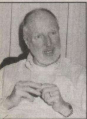
غراهام فولر يتحدث للصحافيين

كتب - محمد الأمير: أشار عدد من الكتاب والصحافيين مع كبير المستشارين السياسيين الأمريكيين السيد غراهام فولر عدة نقاط تتعلق بالوضع الراهن بمنطقة الشرق الأوسط. وقال المسؤول الأمريكي في ندوة مصغرة نظمها السفارة الأمريكية بالرياض مساء أمس الاثنين إن زيارة صاحب السمو الملكي الأمير عبدالله بن عبدالعزيز ولي العهد نائب رئيس مجلس الوزراء ورئيس الحرس الوطني للولايات المتحدة مهمة جداً للغاية وتنتصب في مصلحة إيجاد حل للنزاع القائم بمنطقة الشرق الأوسط. وطالب المستشار السياسي كافة الدول العربية باخترق المجتمع الأمريكي والتأثير القوي للرأي العام من خلال التعاون المكثف مع القوى الموجودة في الولايات المتحدة وأهمها لوبي البترول، ولوبي رجال الأعمال. وكشف السيد غراهام أن هناك تعاوناً مشتركاً بين الجمعيات المسيحية التبشيرية واليهودية مؤكداً أن منظمة أيباك عبارة عن جهاز محافظ يدعم ويؤيد حزب اليكود الاسرائيلي. وأوضح السياسي الأمريكي أن أحداث 11 سبتمبر اثرت وبشكل سلبي على العالم.