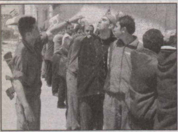
جندي مجرم الحرب شارون يمارس أشبه صور الدلال تجاه فلسطيني مكبل اليدين تحت انظار رفاقه الاسرى في جنوبي مدينة الخليل المحتلة بالضفة الغربية