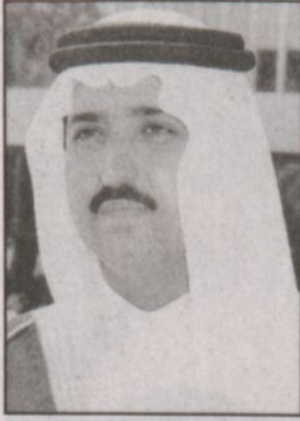
الأمير أحمد بن عبدالعزيز

كتب - محمد الشهلي: ■ يعقد أصحاب السمو والمعالي وزراء الداخلية في مجلس التعاون الخليجي اجتماعهم التشاوري نصف السنوي بعد غد الأربعاء في العاصمة الرياض. ويتأسس وفد المملكة نيابة عن صاحب السمو الملكي الأمير نايف بن عبدالعزيز وزير الداخلية المتواجد حالياً خارج المملكة في رحلة علاجية صاحب السمو الملكي الأمير أحمد بن عبدالعزيز نائب وزير الداخلية. وكون هذا الاجتماع نصف السنوي تشاوريا فهو بدون جدول أعمال بل للتشاور في القضايا التي تهم دول مجلس التعاون الخليجي ويستمر الاجتماع يوماً واحداً.