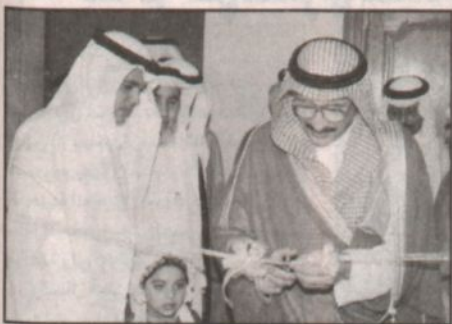
الأمير محمد بن ناصر يفتتح معرض الكتاب ضمن فعاليات النشاط الثقافي