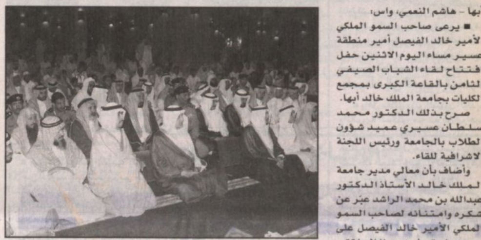
الأمير خالد الفيصل في المحاضرة