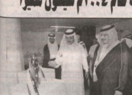
الأمير سلطان بن فهد يتجول في معرض الفنانة فوزية