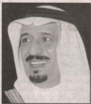
الأمير سلمان بن عبدالعزيز