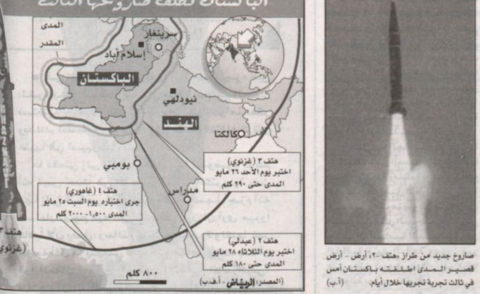
الباكستان تطلق صاروخاً بالستياً من طراز (هتف - ٢) من إقليم بلوشستان

الباكستانية تنتهي، بهذا الإطلاق. وأعاد الرئيس برونيز مشرف بخطام الضباط والرجال الذين ساهموا في صنع هذا الصاروخ. وكانت باكستان أطلقت صاروخاً بالستياً من طراز (هتف - ٢) من إقليم بلوشستان في ٢٠ مايو ٢٠٠٢، وهو صاروخ بالستية مع قدرة على مسافة ٢٨٠ كلم. وأعلنت باكستان ان هذا الصاروخ من طراز (هتف - ٢) هو صاروخ بالستية مع قدرة على مسافة ٢٨٠ كلم.