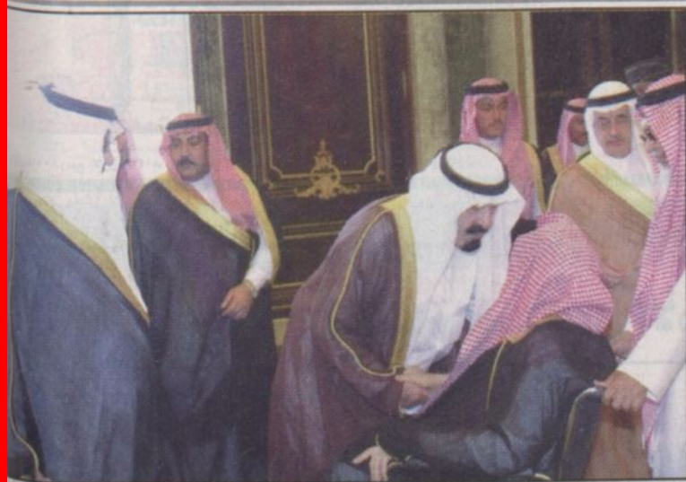
نائب خادم الحرمين الشريفين يستقبل الأمراء والوزراء وقادة وضباط الحرس الملكي وكبار المسؤولين.