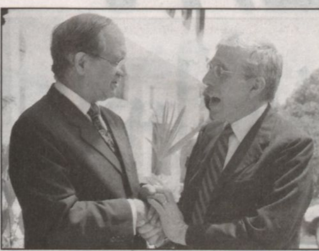
وزير خارجية باكستان يصافح نظيره البريطاني جاك ستررو الذي وصل إلى اسلام آباد في محاولة لتهدئة حدة التوتر بين باكستان والهند

فرنانديز أمس (الثلاثاء) أن عمليات تسلك من باكستان إلى كشمير ما زالت متواصلة خلافاً لتصريحات الرئيس الباكستاني برونيز مشرف.