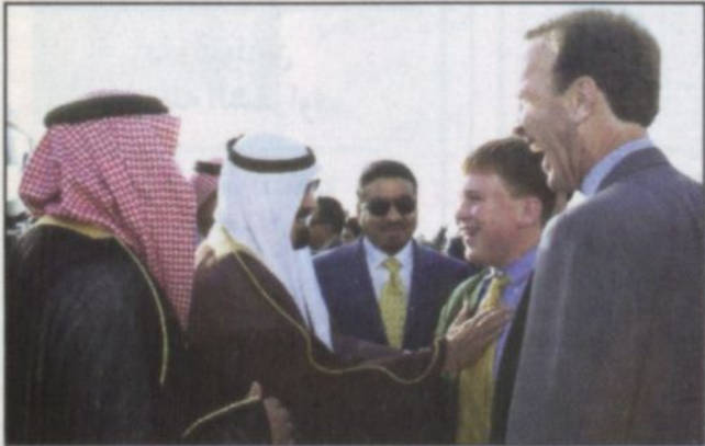
سمو ولي العهد خلال مغادرته أمريكا

خوجه وأعضاء سفارة المملكة في المغرب. حفظ الله سمو ولي العهد في سفره وإقامته. ووصل في معية صاحب السمو الملكي الأمير عبدالله بن عبدالعزيز كل من صاحب السمو الأمير فيصل بن عبدالله بن محمد آل سعود وكيل الحرس الوطني بالقطيع الغربي وصاحب السمو الملكي الأمير خالد بن فيصل بن تركي بن عبدالعزيز آل سعود وصاحب السمو الأمير تركي بن عبدالله بن محمد آل سعود المستشار بديوان سمو ولي العهد وصاحب السمو الملكي الأمير عبدالعزيز بن عبدالله بن عبدالعزيز المستشار بديوان سمو ولي العهد وصاحب السمو الملكي الأمير فيصل بن خالد بن عبدالعزيز المستشار بديوان سمو ولي العهد وصاحب السمو الملكي الأمير محمد بن سلمان بن محمد آل سعود المستشار بديوان سمو ولي العهد وصاحب السمو الملكي الأمير طيار تركي بن عبدالله بن عبدالعزيز وصاحب السمو الملكي الأمير عبدالعزيز بن فهد بن عبدالعزيز وزير الدولة عضو مجلس الوزراء رئيس ديوان رئاسة مجلس الوزراء وصاحب السمو الملكي الأمير منصور بن عبدالله بن عبدالعزيز وصاحب الاستاذ عبدالمحسن بن عبدالعزيز التويجري ومعالى رئيس الشؤون الخاصة لسمو ولي العهد الاستاذ ابراهيم بن عبد الرحمن الطاسان ومعالى نائب رئيس ديوان سمو ولي العهد والسكرتير الخاص الاستاذ خالد بن عبدالعزيز التويجري ومعالى وكيل المراسم الملكية الاستاذ محمد بن عبد الرحمن الطباشي.