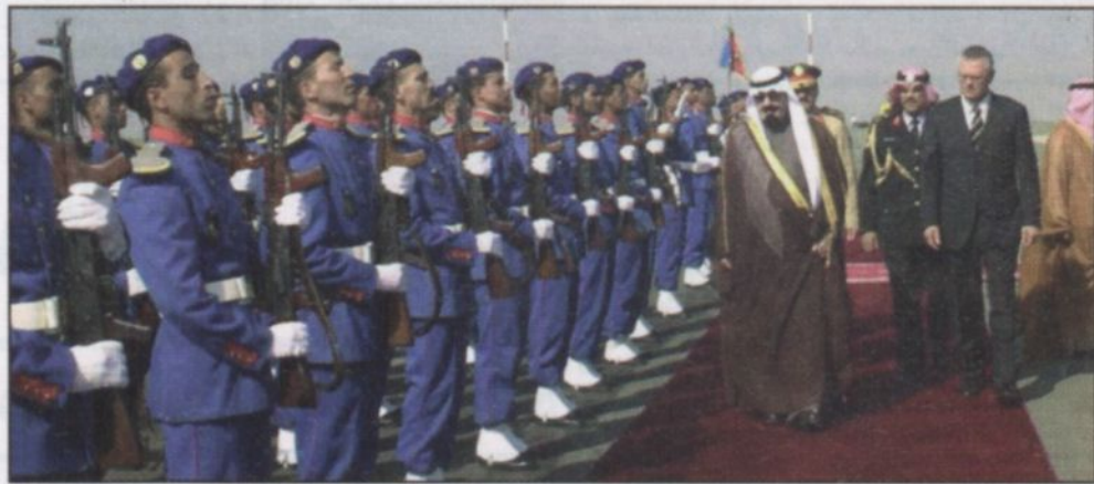
وصول سمو ولي العهد إلى الدار البيضاء (و.أ.س)

خوجه وأعضاء سفارة المملكة في المغرب. حفظ الله سمو ولي العهد في سفره وإقامته. ووصل في معية صاحب السمو الملكي الأمير عبدالله بن عبدالعزيز كل من صاحب السمو الأمير فيصل بن عبدالله بن محمد آل سعود وكيل الحرس الوطني بالقطيع الغربي وصاحب السمو الملكي الأمير خالد بن فيصل بن تركي بن عبدالعزيز آل سعود وصاحب السمو الأمير تركي بن عبدالله بن محمد آل سعود المستشار بديوان سمو ولي العهد وصاحب السمو الملكي الأمير عبدالعزيز بن عبدالله بن عبدالعزيز المستشار بديوان سمو ولي العهد وصاحب السمو الملكي الأمير فيصل بن خالد بن عبدالعزيز المستشار بديوان سمو ولي العهد وصاحب السمو الملكي الأمير محمد بن سلمان بن محمد آل سعود المستشار بديوان سمو ولي العهد وصاحب السمو الملكي الأمير طيار تركي بن عبدالله بن عبدالعزيز وصاحب السمو الملكي الأمير عبدالعزيز بن فهد بن عبدالعزيز وزير الدولة عضو مجلس الوزراء رئيس ديوان رئاسة مجلس الوزراء وصاحب السمو الملكي الأمير منصور بن عبدالله بن عبدالعزيز وصاحب الاستاذ عبدالمحسن بن عبدالعزيز التويجري ومعالى رئيس الشؤون الخاصة لسمو ولي العهد الاستاذ ابراهيم بن عبد الرحمن الطاسان ومعالى نائب رئيس ديوان سمو ولي العهد والسكرتير الخاص الاستاذ خالد بن عبدالعزيز التويجري ومعالى وكيل المراسم الملكية الاستاذ محمد بن عبد الرحمن الطباشي.