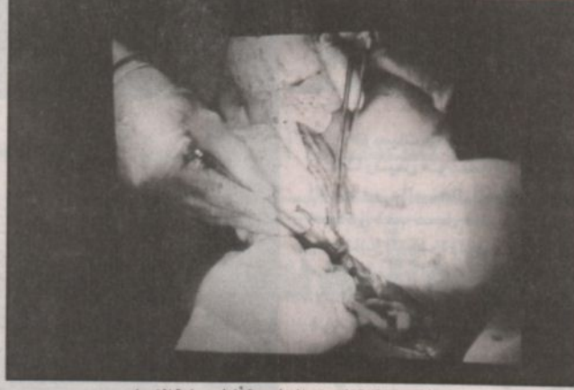
لقطة من شاشة العرض الخارجية أثناء عملية الفصل

واهتمام نائب خادم الحرمين بجسد الواقع حديث، مثل المؤمنين في توادهم وتعاتفهم وترحمهم كمثل الجسد الواحد إذا اشتكى منه عضو تداعى له سائر الجسد بالسهر والحمى، وأسأل الله أن يكمل العملية بالنجاح وأمل أن تسير صداقتنا إلى الأوفى دائماً. وفي سؤال لـ «الرياض» حول ما إذا كانت هذه العملية بداية لتعاون بين البلدين في المجال الصحي قال السفير المايزي في السابق كان هناك تعاون في مجال التعليم والآن في جميع المجالات التعليمية والعلم والاتصالات وكل شيء ونحاول تعميق هذا التعاون حالياً فيما بين البلدين الشقيقين المسلمين. وصف السفير مشاعره وهو يشاهد مدينة الملك عبدالعزيز الطبية الصرح الطبي الشامخ قائلاً: أعتز بهذا الصرح وبإنجاز هذه العملية في بلد مسلم وعلى أيدي أطباء مسلمين وإن شاء الله في المستقبل نتمتع على أنفسنا كمسلمين في هذا المجال وغيره. مشاهدات من التغطية بدأت العملية بدخول فريق