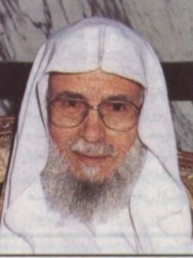
د. عبدالله التركي

باريس - و.أ.س: أكد معالي الأمين العام لرابطة العالم الاسلامي الدكتور عبدالله بن عبدالعزيز التركي ان الزيارة التي يقوم بها وفد الرابطة حاليا لكل من فرنسا وإيطاليا وروسيا تهدف الى ايجاد أرضية خصبة للحوار مع القيادات السياسية والفكرية والثقافية والاكاديمية وتصحیح المفاهيم الخاطئة التي يحملها البعض عن الاسلام والمسلمين بعد أحداث الحادي عشر من سبتمبر. وأوضح معاليه في تصريح لوكالة الانباء السعودية عقب وصوله فجر امس الى باريس أن بعض الجهات تثير اتهامات غير مسؤولة من وقت لآخر وتوجه عبر بعض وسائل الاعلام الغربية للمنظمات الخيرية الاسلامية من أنها منظمات تدعم الارهاب. وبيّن أن الاعمال والمناشط التي تقوم بها الهيئات والمنظمات الاسلامية تلتزم بالسلامة والالتزام بالقيم النبوية الاسلامية وتتمتع بمشروعة متعددة يدرها الجميع مثل المجالات الصحية والتعليمية والتدريب الفني والزراعة وتأتي وفق برامج وخطط مدروسة تتم في وضح النهار. وطالب معالي الدكتور عبدالله التركي الاعلام الغربي بالتعقل والموضوعية عندما يتحدث عن المنظمات والهيئات الاسلامية الخيرية وأن ينظر الى الاعمال التي تقوم بها هذه الهيئات بكثير من الانصاف وأن يوازي في رؤيته الاعمال التي تقوم بها الهيئات والمنظمات الكسنية في شتى أنحاء العالم بالموازاة مع هذه الانشطة التي تقوم بها المنظمات الاسلامية. ودعا معاليه كذلك رجال الفكر الغربيين الى ترشيح المعسل الاعلامي بما يقدمه المصالح البشرية الكبرى بعيدا عن الصهيونية العالمية.