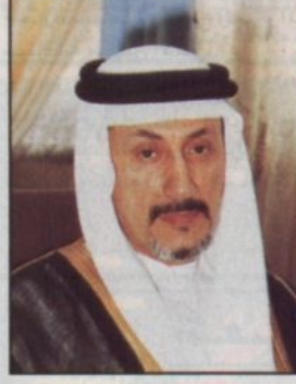
د. أسامة شبكي

كتب- مندوب «الرياض»: يعرض معالي وزير الصحة الدكتور أسامة شبكي عند الساعة الثانية عشرة والنصف من ظهر غد السبت ٢٨ رجب في قاعة الدراسات العليا بمستشفى الملك فيصل التخصصي ومركز الأبحاث بالرياض افتتاح فعاليات الندوة الخليجية الخامسة للتمريض الذي تعقد هذه المرة في المملكة العربية السعودية ويشترك بها مسؤولو قطاع التمريض في دول المجلس الست. وتنظم هذه الندوة بالتعاون بين المستشفى التخصصي والمكتب التنفيذي لمجلس وزراء الصحة الخليجين ووزارة الصحة السعودية وتبدأ فعالياتها العلمية عند الساعة الثامنة والنصف من صباح اليوم السبت وتستمر لمدة ثلاثة أيام تحت شعار «تقييم تعليم وممارسة التمريض من خلال قوانين المهنة» وتطرحد من خلالها العديد من المحاضرات من بينها طرق تعليم التمريض في الماضي والحاضر والمستقبل وتأثيرها على جودة مهنة تعليم التمريض وممارسته، والقضايا المؤثرة على تعليم التمريض في دول مجلس التعاون، وضمن جوده الرعاية الصحية من خلال وضع القوانين والتعليم التي تضمن الكفاءة في الممارسة التمريضية.