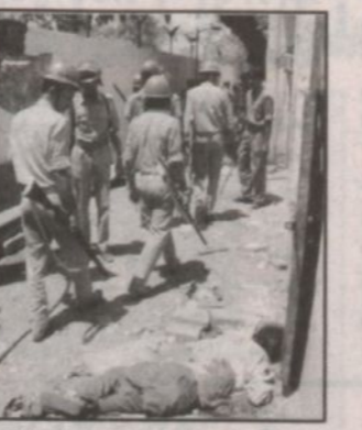
مجموعة من رجال الشرطة يبرمون بجانب جثث ضحايا العنف في كوغرات.

تقدمت بمذكرة إلى حكومة كوغرات في مارش العاصي تطلب منها إعداد خطوط عامة للتحقيق الزهري في الحوادث التي طرقت لحماية المشردين وإعادةهم إلى بيوتهم وتأهيلهم لبدء حياتهم من جديد. وهناك شعور عام للمتابعين داخل البلاد وخارجها بأن حكومة كوغرات قد فشلت في مهامها الدستورية والقانونية لحماية الضحايا وأهليهم وإزالة العقاب بالجناة وذلك نظراً إلى أن كبير وزراء الولاية ناريندار مودي - المتهم الرئيسي بتدبير وتشجيع هذه الحوادث - هو لا يزال سدة الحكم ولم تسجل ضده أية قضية.