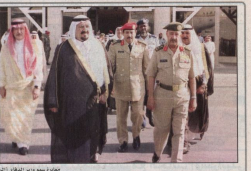
مغادرة سمو وزير الدفاع (الرياض ووصولها الى الطائف، واس)