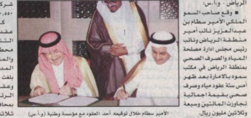
الأمير سطايم خلال توقيع أحد العقود مع مؤسسة وطنية

الرياض - وأ.س: وقع صاحب السمو الملكي الأمير سطايم بن عبدالعزيز نائب أمير منطقة الرياض ونائب رئيس مجلس إدارة مصلحة المياه والصرف الصحي بمنطقة الرياض في مكتب سموه بالإمامة بعد ظهر أمس ستة عقود مياه وصرف صحي بقيمة إجمالية تجاوزت المائتين وسبعة وثلاثين مليون ريال. المصلحة المهندس خالد بن عبدالله البواردي أن هذه العقود تشمل عقد تنفيذ خط مياه رئيسي بمدينة الرياض بطول يبلغ حوالي اثنين وعشرين كيلومتراً ويغمر يتراوح بين مترين ومتر ونصف والذي تم توقيعهم مع شركة أبناء محمد عبدالمحسن الخرافي بمبلغ (٧٩,٩٩٩,٩٠٠) ريالاً. وعقد تنفيذ قناة صرف الغااض التهائي لمحطة معالجة مياه الصرف الصحي بطريق الخرج بطول يبلغ حوالي ثلاثة وثلاثين كيلومتراً مع التناقل المهيبند وجوابر بمبلغ ٧٤,٥٩٧,٥٥٩ ريالاً وعقد تنفيذ توصيلات مياه منزلية متفرقة في أجزاء من مدينة الرياض مع