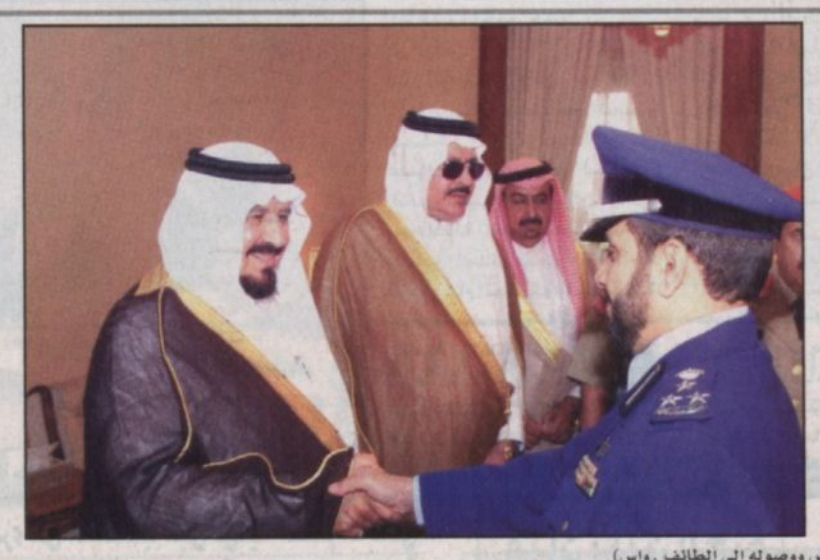
مغادرة سمو وزير الدفاع (الرياض ووصولها الى الطائف، واس)