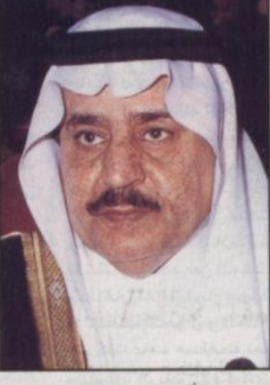
الأمير نايف بن عبدالعزيز

الجوف - فهد الكريع: وجه صاحب السمو الملكي الأمير نايف بن عبدالعزيز وزير الداخلية رئيس مجلس القوى العاملة خطابي شكر وتقدير لصاحب السمو الملكي الأمير عبد الله بن عبدالعزيز أمير منطقة الجوف وسمو نائبه صاحب السمو الملكي الأمير هادي بن عبد العزيز شُكراً على جهود سموهما في تطبيق قرارات السعوية في جميع المجالات المتاحة. من جهة أخرى تلقى سمو أمير المنطقة وسمو نائبه خطابي شكر من معالي وزير العمل والشؤون الاجتماعية الدكتور علي بن إبراهيم النملة على ما يبذله سموهما من جهد في تطبيق قرارات القرارات الخاصة بالسعوية بهدف تأمين المزيد من فرص العمل لأبناء هذا الوطن. جاء ذلك بعد اطلاع معاليه على