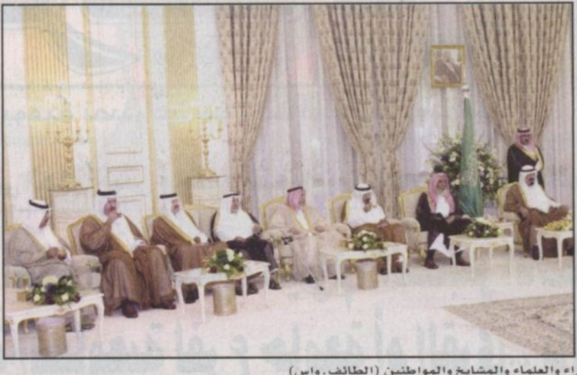
سمو نائب خادم الحرمين الشريفين يستقبل الأمراء والعلماء والشيوخ والمواطنين (الطائف، واس)