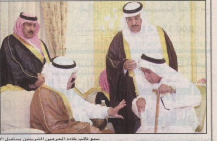
سمو نائب خادم الحرمين الشريفين يستقبل الأمراء والعلماء والشيوخ والمواطنين (الطائف، واس)