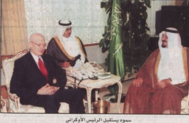
سموه يستقبل الرئيس الأوكراني