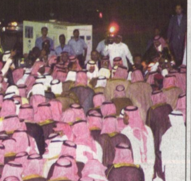
سموه مع عدد من المسؤولين