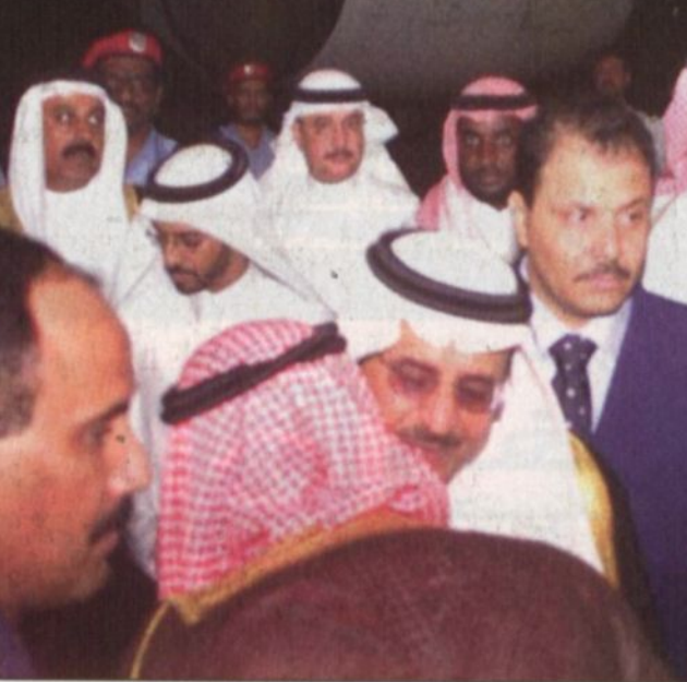
سموه مع عدد من المسؤولين

الأمير نايف يعود إلى أرض الوطن بعد رحلة علاجية ناجحة