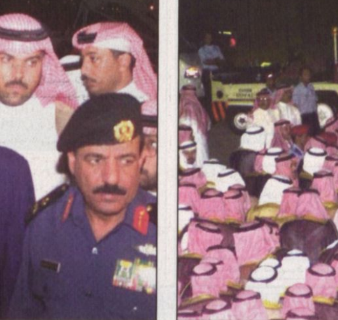
سموه مع عدد من المسؤولين