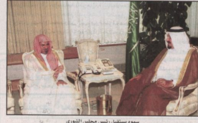
سموه يستقبل رئيس مجلس الشورى