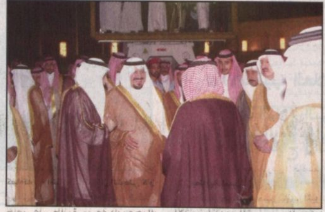
سموه مع عدد من المسؤولين