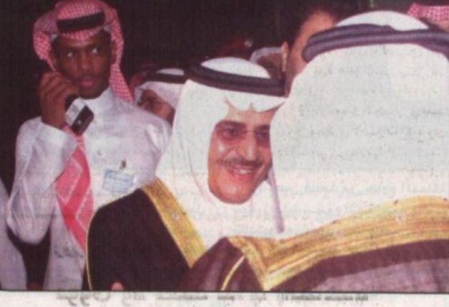
سموه مع عدد من المسؤولين

الرياض - واس: صدر حديثاً عن وزارة الشؤون الإسلامية والأوقاف والدعوة والإرشاد كتاب بعنوان الإسلام في فكر ونهج خادم الحرمين الشريفين، تناول فيه مسيرة خادم الحرمين الشريفين الملك فهد بن عبدالعزيز بن عبد الرحمن آل سعود - حفظه الله - ومنجزاته الذي وهب فكره وحياته لخدمة دينه وبلده وشعبه وأمته. وتضمن الكتاب كلمة معالي وزير الشؤون الإسلامية والأوقاف والدعوة والإرشاد الشيخ صالح بن عبدالعزيز آل الشيخ أبرز فيها إنجازات وجود ودعم خادم الحرمين الشريفين لقضايا الإسلام والمسلمين. واستعرض الكتاب الذي يضم خمسة فصول أبرز وأهم عطاءات خادم الحرمين الشريفين في خدمة الإسلام والدعوة الإسلامية.