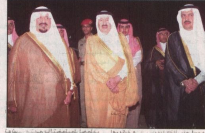
سموه مع عدد من المسؤولين