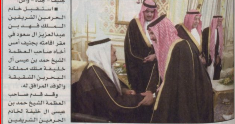
خادم الحرمين يستقبل الشيخ حمد