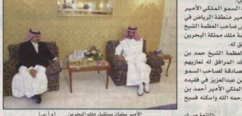
الأمير سلمان يستقبل ملك البحرين