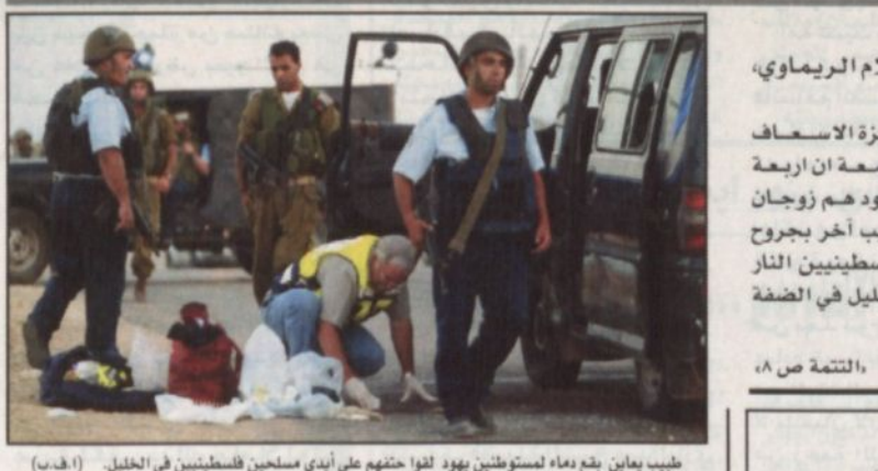
طبيب يعان بنوع معاه مستوطنين يهود لثقتهم على أيدي مسلحين فلسطينيين في الخليل.