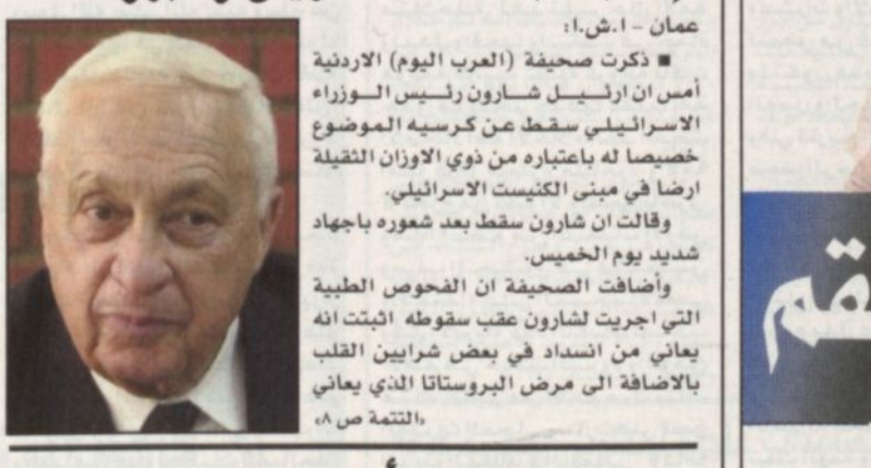
عمان - أ.ش.١: ذكرت صحيفة (العرب اليوم) الاردنية أمس ان ارئيل شارون رئيس الوزراء الاسرائيلي سقط عن كرسيه الموضوع خصيصاً له باعتباره من ذوي الأوزان الثقيلة ارضاً في مبنى الكنيست الاسرائيلي. وقالت ان شارون سقط بعد شعوره باجهاد شديد يوم الخميس. وأضافت الصحيفة ان الفحوص الطبية التي اجريت لشارون عقب سقوطه اثبتت انه يعاني من انسداد في بعض شرايين القلب بالإضافة الى مرض البروستاتا الذي يعاني (التتمة ص ٨).