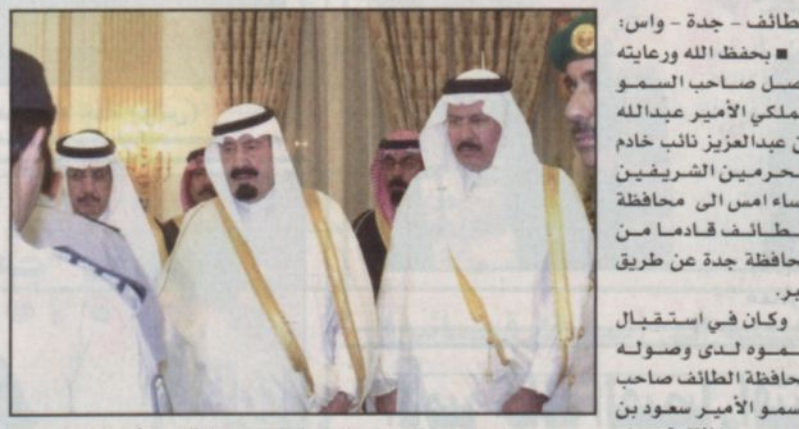
وصول سمو نائب خادم الحرمين الشريفين الطائف (و.أ.س)