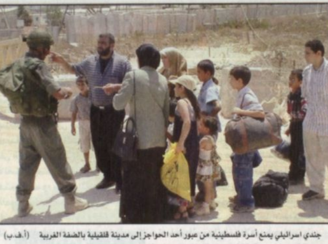
جندي إسرائيلي يمتص أسرة فلسطينية من عبر أحد الجواز إلى مدينة قلقيلية بالضفة الغربية.

القدس المحتلة - وكالات الأنباء: ■ قتلت قوات الاحتلال الاسرائيلية بدم بارد امس احد كوادر كتائب شهداء الأقصى القريبة من حركة فتح في قرية اليامون قرب جنين في الضفة الغربية. وأوضح مسؤولون أمنيون ان الشهيد غزال فريحات الذي يبلغ الثالثة والعشرين قتل خلال عملية توغل قامت بها القوات الاسرائيلية لتسليمها العيايات والمدرمعات إلى القرية حيث أوقفت أيضاً خمسة فلسطينيين. وقال شهود عيان من سكان البلدة في الاتصالات هاتفية مع وكالة الأنباء الكويتية (كونا) ان نحو ثلاثين جندياً اسرائيلياً طوفوا منزل الشهيد