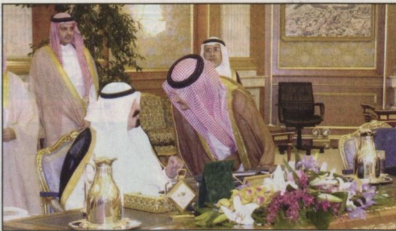
الأمير عبدالله بن عبدالعزيز في حديث مع الأمير سعود الفيصل خلال جلسة مجلس الوزراء، واس.

جدة - واس: ■ بعث خادم الحرمين الشريفين الملك فهد بن عبدالعزيز آل سعود برقية تهنئة إلى صاحب السمو الشيخ جابر الأحمد الصباح أمير دولة الكويت بمناسبة نجاح العملية التي أجريت لسموه في العين وخروجه من المستشفى سلامة الله وحفظه. وقال الملك المفدى «اننا إذ نحمد الله ونشكره على ذلك لسنائه سبحانه أن يديم على سموك نعمة الصحة والعافية ولا يريكم أي مكروه». وبعث صاحب السمو الملكي الأمير عبدالله بن عبدالعزيز ولي العهد ونائب رئيس مجلس الوزراء