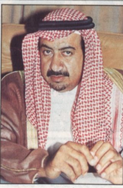
فهد بن معمر

الطائف - أحمد حسن الزهراني: معالي محافظ الطائف رئيس اللجنة العامة للتنشيط السياحي الأستاذ فهد بن عبدالعزيز بن معمر تحدث لـ الرياض، حضرته ووضوحه المعهود حيث وضع النقاط على الحروف وأجاب على الكثير من التساؤلات والملاحظات كعادته بقلب مفتوح فيما يلي نص الحديث: معالي المحافظ، يحل في كل عام صاحب السمو الملكي الأمير عبد الله بن عبدالعزيز نائب خادم الحرمين الشريفين في زيارة تفقدية للطائف تحمل كل الخير للطائف وهي فرحة غامرة لأهالي الطائف حاضرة المدينة بكافة المسؤولين، وقد حظيت هذه المدينة بمشروعات تنموية نفذت على أعلى المستويات في مجال التعليم والصحة والكهرباء والهاتف والطرق والمياه وأبرزها وضع حجر الأساس لكلية الطب بفرع جامعة أم القرى بالطائف والتي مقرها قصر الملك سعود بالحوية والذي أمده سموه لوزارة التعليم العالي وبعد الانتقال لهذا المقر بعد تسييره صدرت أوامر خادم الحرمين الشريفين بالتنشيط السياحي في الطائف التي بدأت الدراسة بها مطلع