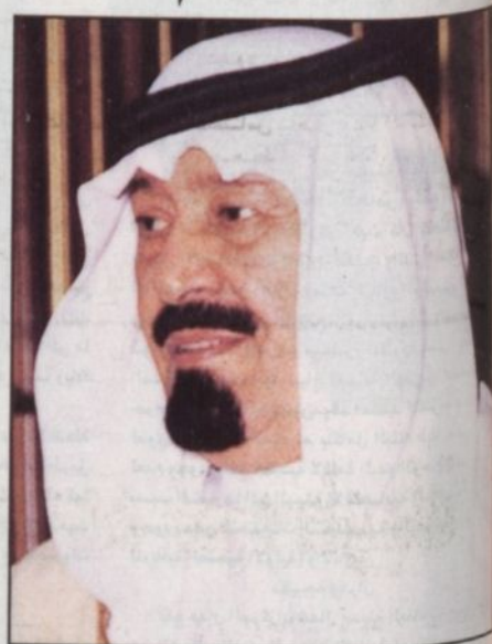
الأمير عبد الله بن عبدالعزيز

والحجاز - وعنه قال المؤرخ محمد حسين هيكل، وهذا القصر من أفخم قصور الحجاز بل لعله أفخمها جميعاً.. ويقع القصر خارج سور الطائف القديم في الشمال الشرقي منه في حي شبرا وقد اتخذه الملك عبدالعزيز بن عبد الرحمن آل سعود قصراً خلال فصل الصيف وشهد أحداثاً تاريخية في حياة المؤسس ثم اتخذه الملك فيصل يرحمه الله قصراً لرئاسة مجلس الوزراء أثناء الصيف ثم صاحب السمو الملكي الأمير منصور بن عبدالعزيز وكذلك صاحب السمو الملكي الأمير مشعل بن عبدالعزيز مقرّاً لوزارة الدفاع ثم آل القصر إلى وزارة الدفاع والطيران بعد وفاة الملك فيصل وكان مقرّاً للنائب الثاني لرئيس مجلس الوزراء وزير الدفاع والطيران والمفتش العام صاحب السمو الملكي الأمير سلطان بن عبدالعزيز وحوله سموه إلى متحف حربي ويعدّها عرض سموه على مقام خادم الحرمين الشريفين تحويل القصر إلى متحف تراثي وتسليمه لترميمه وتجديده وإضافة لمسات فنية جديدة لتحويله إلى متحف عام يزوره نائب خادم الحرمين الشريفين اليوم.