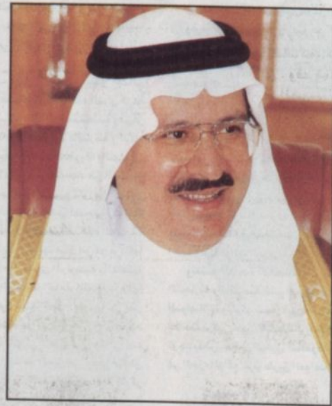
الأمير عبدالمجيد بن عبدالعزيز