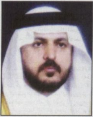
بقلم: أحمد حسن الزهراني*

في كل صيف يلتقي أهالي الطائف وزوارها بصاحب السمو الملكي الأمير عبد الله بن عبدالعزيز نائب خادم الحرمين الشريفين الذي يأتي ليرسم البسمة على كل الشفاه فيفتح مشاريع الخير والنماء ويوزع مواقع ومشاريع مختلفة وتنتعش المدينة التي طالما زارها الملوك والأمراء وتحول إلى خلية عمل لا ينهي.. ومعه ينتشي المواطن ويشاركه المقيم فرحة اللقاء الكبير بهذه القيادة التي ترسم ملامح التنمية المباركة وتحول كل الأمكنة إلى عطاءات خير لخدمة الإنسان في بلد احتضن الجميع وزرع الأمن والأمان في أرجائه. ان مشاريع الخير التي تعيشها المحافظة في هذا العهد الزاهر كانت ومازالت من اولويات حكومتنا الرشيدة في كل عهد ويظل هذا العهد الزاهر موشوماً بالتنمية والتطوير وحظيت الطائف بالكثير من الالفتات الرائعة من لدن قيادة هذه البلاد العالمة رغبة منها في خدمة المواطن واعادة صياغة المصيف الاول لتكون نواة انطلاق السياحة المحلية إلى الافاق العالمية بما لا يتعارض مع الشريعة الإسلامية والتقاليد والعادات لهذه البلاد، وقد كان صاحب السمو الملكي الأمير عبدالمجيد بن عبدالعزيز أمير منطقة مكة المكرمة على الموعد بيني ويطور ويدعم كل الجهود للوصول بهذه المدينة إلى التطلعات المرسومة ولم يبخل معالي محافظ الطائف رئيس اللجنة العامة للتنشيط السياحي الأستاذ فهد بن عبدالعزيز بن معمر بأي جهد لتنشيط الارتقاء بالطائف وتحول حلم الأمل إلى حقيقة نعيشها اليوم بكل تفاصيلها.