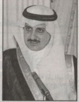
الأمير فهد بن سلطان

المتعب قصيدة نالت استحسان الحضور جسد من خلالها المشاعر الخيضة بهذه المناسبة السعيدة. ثم ارتجل صاحب السمو الملكي الأمير فهد بن سلطان كلمة قال فيها: ان هذه الليلة هي ليالي الوفاء، وهي ليلة افتخر أن أكون متواجداً بينكم لتأخذوا قليلاً مما تستحقون، فأنتم خدمتم دينكم ثم وطنكم ومليكم وبادتوا بالعمل عندما كانت الظروف والامكانيات محدودة ولكن بجهديكم وبغزيمي بالرجال استطعتم ان تكونوا اللبنة الأساسية. وأضاف سموه قائلاً كلكم في مجال عمله وفي موقع العمل