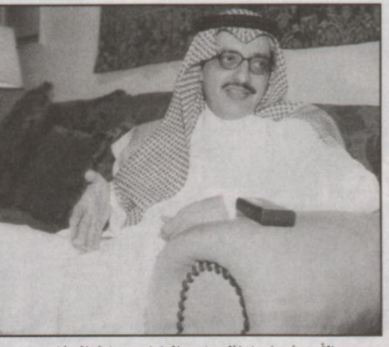
الأمير فيصل بن خالد بن عبدالعزيز وحديث لـ «الرياض».

بهذا القطاع ورغبتم الصادقة في النهوض بالعمل الخيري بشكل عام. ■ «الرياض»: متى سيتم افتتاح مقر للمؤسسة رسمياً وأين سيكون مقر المؤسسة الملك خالد الخيرية الحالي هو في مبنى أبراج الخالدية، شارع الخزان في وسط الرياض.