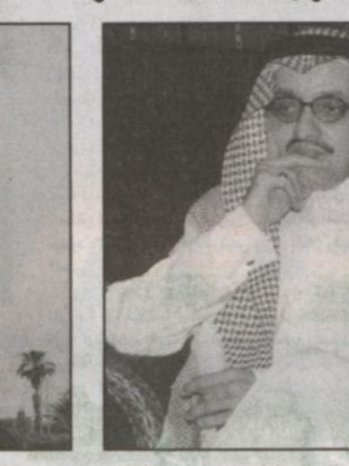
نذكر دائماً فيما يعود لصالح العام وخدمة الجمعيات

■ «الرياض»: هل للمؤسسة مقر في «أبراج الخالدية» التي هي أحد الجوانب الاستثمارية يعود ريعها لصالح نشاطاتها