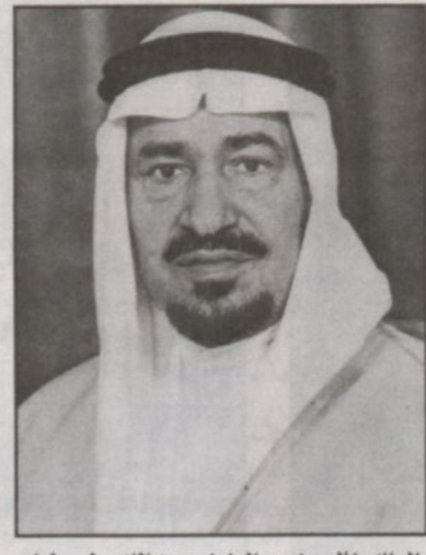
الملك خالد بن عبدالعزيز رحمه الله وطيب ثراه

■ نوه صاحب السمو الملكي الأمير فيصل بن خالد بن عبدالعزيز نائب رئيس مجلس إدارة مؤسسة الملك خالد الخيرية بالرعاية الكريمة لصاحب السمو الملكي الامير عبدالله بن عبدالعزيز ولي العهد نائب رئيس مجلس الوزراء ورئيس الحرس الوطني وصاحب السمو الملكي الأمير سلطان بن عبدالعزيز النائب الثاني لرئيس مجلس الوزراء وزير الدفاع والطيران والمفتش العام. وقال في حديث خاص لـ «الرياض»، إن الرعاية الكريمة هي فخر للجميع وتأكيد لرغبة القيادة النهوض بالعمل الخيري بشكل عام. وأكد ان المؤسسة وهي ترعى فعاليات الملتقى وحملة «خيركم لأهله، إيماناً منها بالدور الكبير الذي يساهم في رفع مستوى خدمات تلك الجمعيات وتبادل خبرات.