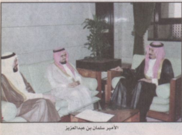
الأمير سلمان بن عبدالعزيز

الرياض - واس: استقبل صاحب السمو الملكي الأمير سلمان بن عبدالعزيز أمير منطقة الرياض بـمكتب سموه بقصر الحكم أمس رئيس الجمعية السعودية للإعاقة السمعية الدكتور خالد بن محمد طيبة وأعضاء مجلس إدارة الجمعية. وتم خلال الاستقبال مناقشة عدد من الموضوعات التي تهم الجمعية. وقد أبدى سموه فخره واعتزازه بهذه الجمعية الأولى من نوعها في المملكة معرباً عن أمله بإنشاء جمعيات خيرية متخصصة مماثلة في المستقبل.