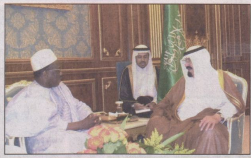
ويستقبل السفير الخراشي