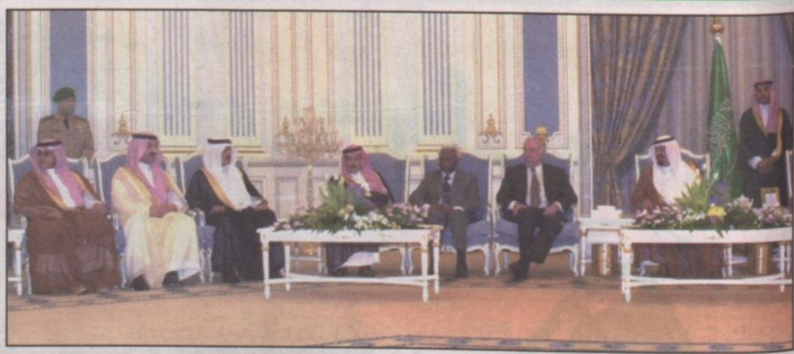
سمو ولي العهد يستقبل جمعاً من المواطنين وضيوف المؤتمر التاسع للشباب