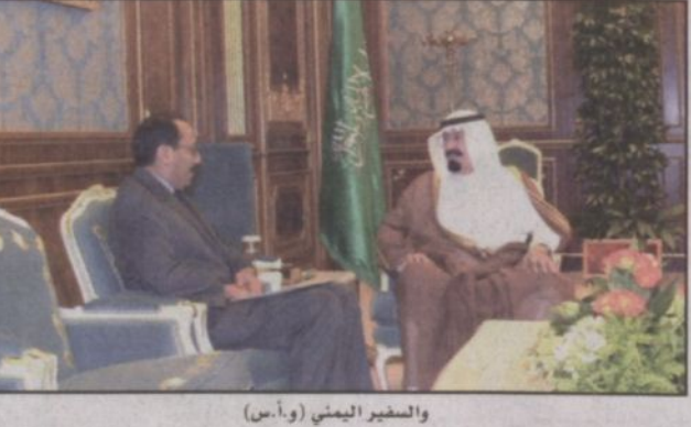
والسفير اليمني

ديوان سمو ولي العهد الأستاذ عبدالمحسن بن عبدالعزيز التويجري. وتلقى رسائل من رؤساء غينيا وجامبيا واليمن.. وتلقى رسائل من رؤساء غينيا وجامبيا واليمن.. وتلقى رسائل من رؤساء غينيا وجامبيا واليمن..