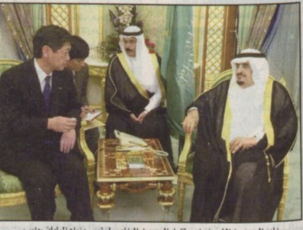
خادم الحرمين الشريفين يستقبل المبعوث الخاص لرئيس وزراء اليابان «واس»

جدة - واس، تسلم خادم الحرمين الشريفين الملك فهد بن عبد العزيز آل سعود رسالة من دولة رئيس وزراء اليابان جونيتشيرو كويشيمو، وقام بنقل الرسالة لخادم الحرمين الشريفين المبعوث الخاص لدولة رئيس وزراء اليابان ماسا هيكو كومورا خلال استقباله - أيده الله - له والوفد المرافق في قصر السلام بجدة أمس، وقد نقل المبعوث الياباني للملك المفدى تحيات وتقدير دولة رئيس وزراء اليابان، كما حملته - حفظه الله - تحياته وتقديره لدولته، وحضر الاستقبال صاحب السمو الملكي الأمير عبد الرحمن بن عبد العزيز نائب وزير الدفاع والطيران والمفتش العام وصاحب السمو الملكي الأمير سعود بن عبد