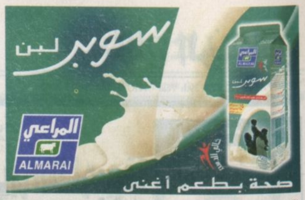
صحة بطعم أغنى