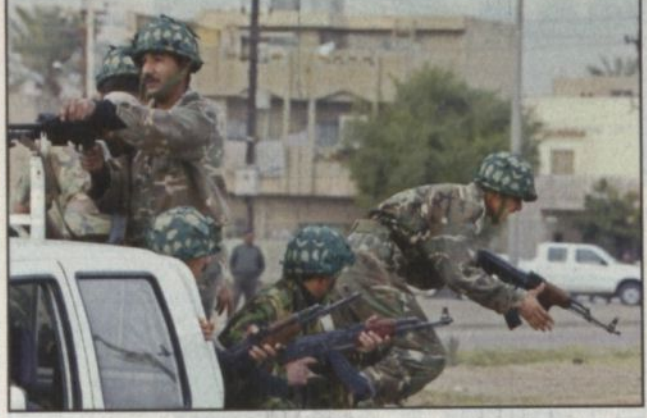
جنود عراقيون من جيش القدس، في عرض عسكري بمناسبة تحريرهم في بغداد أمس

نيويورك - أحمد حسين الياباني، روما، لندن - وكالات الأنباء، أعلن نائب رئيس الوزراء العراقي طارق عزيز أمس في تصريح لكبرى الصحف الإيطالية ان العراق سيقاوم «من منزل إلى منزل» في حال هجوم أمريكي مؤكداً انه ستمضي أشهر قبل ان يسقطوا على بغداد، وستقاوم أطول مدة ممكنة، حتى آخر رجل، وأضاف: يمكننا أن نؤكد لكم ان الأمر لن يكون نزعة للجنود الأميركيين والبريطانيين، انهم يعرفون ذلك جيداً وسيدهون الثمن باهظاً جداً لأن القوة دائما في جانب البلد المحتل.