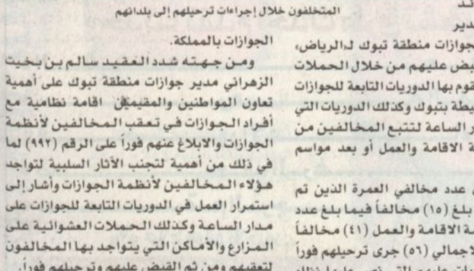
المخلفون خلال اجراءات ترحيلهم إلى بلداتهم