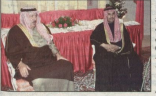
بمقر الحفل سفير مملكة البحرين لدى المملكة راشد بن سعد الدوسري

الرياض - واس: نيابة عن صاحب السمو الملكي الأمير سطم سطم بن عبدالعزيز نائب أمير منطقة الرياض حضر وكيل إمارة منطقة الرياض عبدالله البيهيد مساء أمس حفل سفارة مملكة البحرين بمناسبة اليوم الوطني لبلادها وذلك بمقر طويق بحي السفارات في الرياض. وكان في استقبال وكيل الإمارة