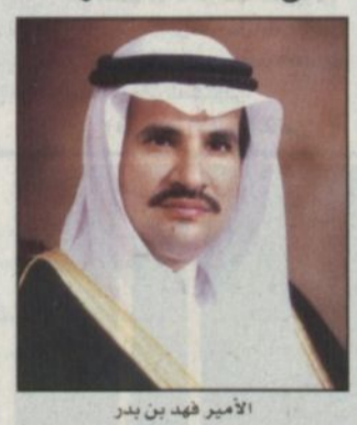
الأمير فهد بن بدر

كتب - سليمان الزكير: افتتح صباح اليوم الثلاثاء مدير برنامج مستشفى القوات المسلحة بالرياض والخرج اللواء الطبيب خلف بن رذن المطيري فعاليات ندوة المستجندات في جراحة العمود الفقري والتي تعقد بقاعة المحاضرات الرئيسية بالمركز الترفيهي بالمستشفى وتستمر لمدة ثلاثة ايام. وأوضح اللواء الطبيب خلف المطيري مدير المستشفى ورئيس شعبة الأعصاب والعمود الفقري ان هذه الندوة التي ستتناول موضوعات عدة حول المستجندات في جراحة العمود الفقري في مجال الجراحة من خلال المناظير للصدر وكذلك المنظار. كما تتناول هذه الندوة محاضرات حول المواد البديلة للترقيع العظمي وكذلك الفشاريف الصناعية للقرنات العنقية. ونوه الدكتور خلف المطيري في ختام حديثه إلى المشاركين في طرح موضوعات هذه الندوة وهم أساتذة من عدد من الدول الغربية إضافة إلى مشاركين من داخل المملكة ومن المشاركين من الخارج البروفيسور جان شارل لويك من فرنسا، البروفيسور جان هوفن من بلجيكا، وكذلك البروفيسور جان دول ميشيت من هولندا كما ستضمن الندوة ورشة عمل للتدريب العملي على عدد من العمليات.