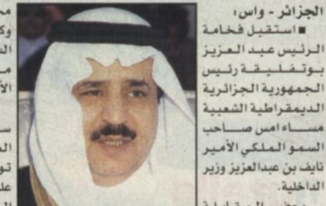
الجزائر - واس، استقبال فخامة الرئيس عبد العزيز بوتفليقة رئيس الجمهورية الجزائرية الديمقراطية الشعبية مساء أمس صاحب السمو الملكي الأمير نايف بن عبدالعزيز وزير الداخلية. وحضر المقابلة معالي وزير الدولة للشؤون الخارجية الجزائرية عبد العزيز بلخادم ومدير الديوان برئاسة الجمهورية الجزائرية العربي بلخير.

وكان صاحب السمو الملكي الأمير نايف بن عبدالعزيز قد وصل إلى الجزائر في وقت سابق أمس حيث كان في استقبال سموه لدى وصوله مطار هواري بومدين الدولي معالي وزير الدولة للشؤون الخارجية والوزير المنتدب المكلف بالجماعات المحلية دحو ولد قابلية وسفير المملكة العربية السعودية لدى الجزائر بكر قزاز. وكان سمو وزير الداخلية قد غادر تونس في وقت سابق أمس بعد زيارة خاصة للجمهورية التونسية. وكان في وداع سموه لدى مغادرته معالي وزير الداخلية التونسي الهادي مهني ومعالي وزير المعارف الدكتور