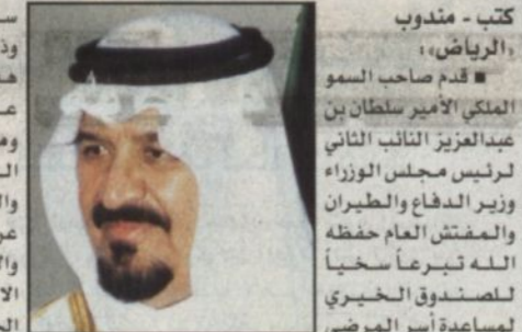
كتب - مندوب الرياض، قدم صاحب السمو الملكي الأمير سلطان بن عبدالعزيز النائب الثاني لرئيس مجلس الوزراء وزير الدفاع والطيران والمفتش العام حفظه الله تبرعاً سخياً للصندوق الخيري لمساعدة أسر المرضى بمجمع الأمل بالرياض. وأوضح المشرف العام على المجمع د.خليل بن ابراهيم القويطي بأن هذه التبرعات الكريمة ليست بمستغربة من سموه الكريم حيث تعود أبناء هذا البلد على الوقفات النبيلة من