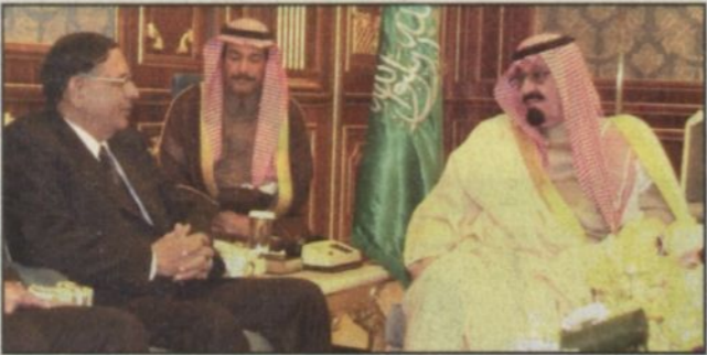
الرياض - واس، استقبال صاحب السمو الملكي الأمير عبد الله بن عبدالعزيز ولي العهد نائب رئيس مجلس الوزراء رئيس الحرس الوطني في مكتبه بالديوان الملكي في قصر اليمامة بالرياض أمس معالي رئيس برلمان سري لانكا جوزيف مهايكل بيريرا يرافقه معالي وزير العمل والتوظيف ماهيندا سامار ومعالي وزير تطوير المنطقة الغربية في سري لانكا محمد حنيفه محمد ومعالي وزير الشؤون البرلمانية عبد الحميد أزرو وأعضاء وفد البرلمان الذين يقومون حالياً بزيارة للمملكة.